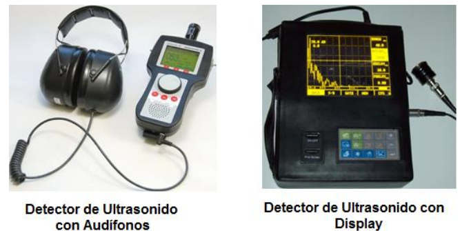
Figura 2. Detectores de Ultrasonido.

Para detectar el ultrasonido, se utiliza un instrumento llamado detector de ultrasonidos el cual está diseñado para capturar ondas ultrasónicas y convertirlas en señales con frecuencias dentro del rango de audición humana. Este dispositivo cuenta con la tecnología necesaria para que una vez convertidas las ondas de ultrasonido puedan escucharse a través de audífonos o visualizarse en un display por medio de un aumento de su intensidad como puede apreciarse en la Figura 2.