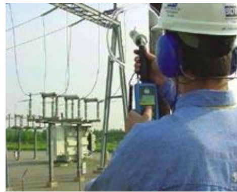
Figura 6. Inspección de Instalaciones Eléctricas utilizando la técnica de ultrasonido [5].