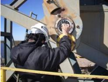
Figura 4. Monitoreo de Rodamientos con Ultrasonido [3].