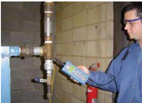
Figura 5. Detección de Fugas de Presión o Vacío por medio del Ultrasonido [4].