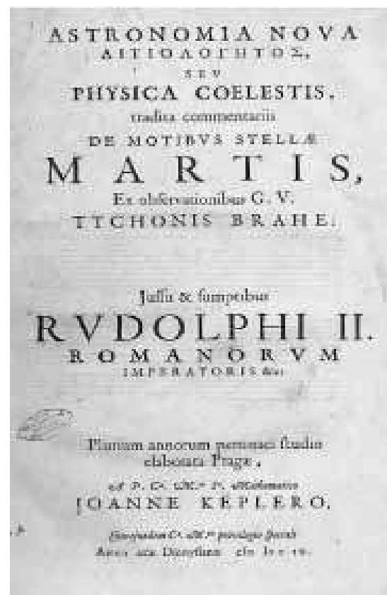
Ilustración 2. Frontispicio de la Astronomía Nova 1609.

Años antes de la publicación de la Astronomía Kepler, envía una copia de su Mysterium a Tycho de Brahe, y análogamente, tal maestro de la astronomía deseaba disuadirlo con respeto a que tal “conjetura salvaje” era una fantasía de juventud. Sin embargo, Tycho estuvo impresionado por la inteligencia y originalidad de este joven astrónomo. Para la década de 1600, Tycho necesitaba el talento matemático del joven Kepler para el “conocimiento” de sus observaciones astronómicas de toda una vida, mientras que Kepler necesitaba el acceso a los datos astronómicos de Tycho para verificar su gran “misterio del universo”. 14