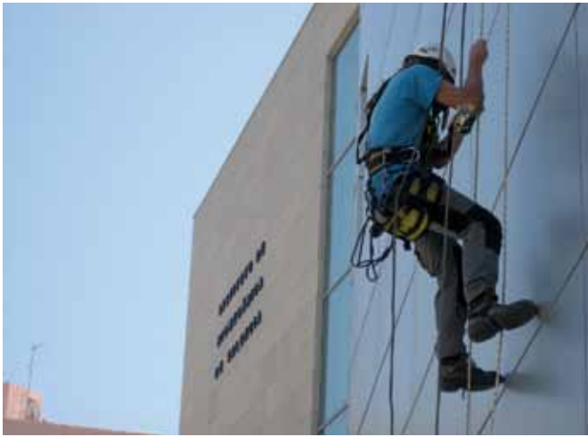
Figura 1. Estudio de campo en la fachada del IBV.

más importantes que deben ser consideradas en el asiento. En el desarrollo del estudio se ha efectuado un grupo de discusión con trabajadores del sector, así como ensayos de campo mediante la simulación con trabajadores especializados de las condiciones reales de trabajos verticales.