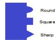
Fig. 3. Categorías de formas de Command Connector

En la Fig. 2, se observan las maneras para crear espacios de encaje de cada bloque. A partir de las formas básicas se pueden componer nuevas y se proporciona a cada bloque un estilo particular que le permita encajar sólo con los que debe.