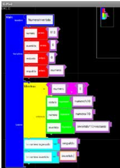
Fig. 8. Implementación del ejercicio dos en Gplad

Para solucionar este problema dentro de la aplicación Gplad, se hizo uso de bloques de variables enteras, ciclos, expresiones e impresiones.