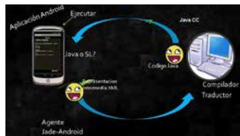
Fig. 6. Arquitectura de Gplad

Para crear esta representación intermedia se obtiene con base en la serialización de cada bloque que se haya creado dentro del escenario.