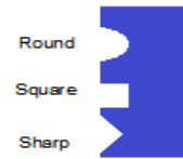
Fig. 2. Categorías de formas de Command Slot

(Round, Sharp o Square) y cada una puede pertenecer a uno de los dos grupos (Command Connector o Command Slot).