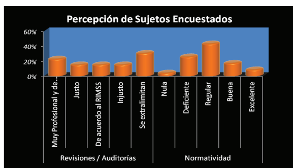
Figura 3. Percepción de los sujetos cuando son revisados por personal del IMSS y su apreciación respecto a su Reglamento.

En promedio la antigüedad de los sujetos que participaron en la aplicación de los cuestionarios tiene tres años desarrollando sus actividades en las organizaciones que fueron parte de la muestra y considerando el número de personas que laboran en el área administrando el ciclo de cumplimiento en la materia son de uno punto tres. El 74% de las empresas encuestadas se dedican a la construcción de vivienda económica o de interés social, mientras que el 13% eran empresas que tienen como giro la construcción de vivienda media o residencial, por otro lado el 9% se especializan a la construcción de naves o plantas industriales, y el 4% tenían un giro diferente. Esto de cierta manera apoya el criterio de que según el análisis de las 100 empresas constructoras más importantes alrededor del 40% de los ingresos de las mismas se generan en las empresas con giro de construcción de vivienda económica o de interés social.