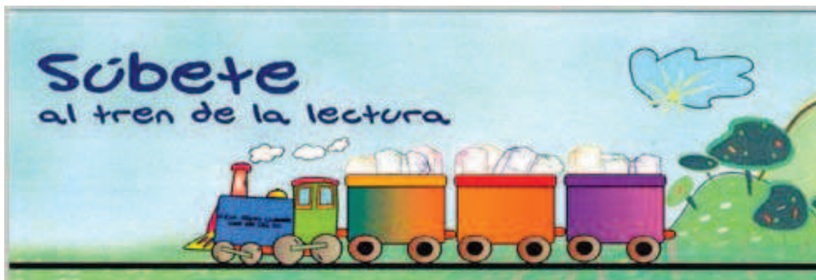
Imagen el proyecto “Súbete al tren de la lectura” del Ministerio de Educación, Cultura y Deporte

Cada curso tendría asignado en la biblioteca escolar un lugar, un vagón del tren con un color determinado, una estantería con libros apropiados para su edad y una estrella, que le será entregada a cada alumno/a por cada libro que lea y devuelva y que se colocará en el vagón del nivel al que correspondiera el alumno/a. Al final del curso veremos cómo están de repletos de estrellas los distintos vagones. Se premiaría al vagón con más marcha lectora, con más estrellas y nombraremos a todos los alumnos/as de ese nivel como los maquinistas del tren de la lectura de la biblioteca escolar de ese curso. Esta es una adaptación que he realizado del Proyecto, ¡SÚBETE AL TREN DE LA LECTURA!, del Ministerio de Educación, Cultura y Deporte.