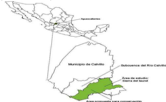
Figura 1. Localización del área de aprovechamiento de Litsea glaucescens .

La mayor parte de "Sierra del Laurel" se localiza en la subprovincia fisiográfica "Sierras y Valles Zacatecanos, con un gradiente altitudinal que va de los 1540 a los 2760 msnm. La geología de la zona data de la era cenozoica, período terciario, y está compuesta por rocas ígneas extrusivas. Los suelos dominantes en las partes altas corresponden al tipo litosol, caracterizados por tener una profundidad menor a 10 cm, limitado por rocas y tepetate, mientras que en las partes bajas predominan los feozem háplico, que se caracterizan por presentar una capa superficial oscura, suave y rica en materias orgánicas y nutrientes, de fertilidad moderada. En menor proporción, están representados otros tipos de suelos, como el planosol éutrico (We), y cambisol cálcico (Bk) con clase textural media, entre otros (INEGI, 2005).