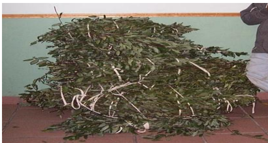
Figura 4. Volumen equivalente a la cantidad de dos tercios de laurel, confiscados por la policía municipal de Calvillo, Ags. en abril de 2005.

Para cuantificar el aprovechamiento del laurel silvestre, se definió de manera previa la unidad de medida utilizada por los recolectores de la especie. En el área de estudio se documentó el uso de al menos dos unidades denominadas "tercio o brazada" y "carga". Cada tercio o brazada es equivalente a la cantidad que puede caber en el espacio que se forma entre los brazos extendidos en posición de abrazo y el pecho, y representa una cantidad aproximada de 30 kg, la que puede variar en función a la talla y constitución de la persona. La carga por su parte, es referida a la cantidad que puede ser transportada en un burro; la carga es equivalente a dos tercios (aproximadamente 60 kg) (Figura 4).