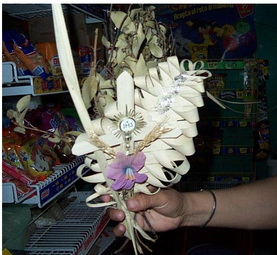
Figura 5. Ramo artesanal de laurel para la celebración del Domingo de Ramos

Cabe mencionar que solo uno de los entrevistados (7.7%) omitió proporcionar datos de tipo económico debido a que recolectó por encargo, por lo que los siguientes resultados se recabaron de los demás recolectores (92.3%). Una vez más, se agrupó a los entrevistados con base en la cantidad de laurel recolectado, y dentro de cada grupo se registró la cantidad de ramos artesanales por tercio, los ramos producidos totales, el precio de venta por ramo, las ventas totales, los gastos y ganancia estimada por tercio.