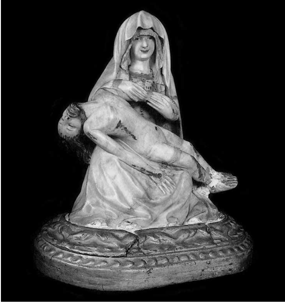
Figura 5. Anónimo, Piedad , finales del siglo xiv-primer cuarto del siglo xv, mármol, 38x 27 cm, Real Monasterio de la Trinidad de Valencia.

una escultura en mármol de 38x 32 centímetros que representa la Piedad y parece ser la titular de una de las capillas del huerto del convento, centro de devoción de los valencianos en época medieval. El cronista del convento de la Trinidad, Agustín Sales, citaba esta capilla y su fama como el origen de la construcción del puente de la Trinidad, que tenía como finalidad conectar la ciudad amurallada con el cenobio. La estructura del conjunto escultórico marcado por la diagonalidad del cuerpo de Cristo lo acerca a la fecha de 1400, y destaca por el dramatismo del cuerpo inerte de