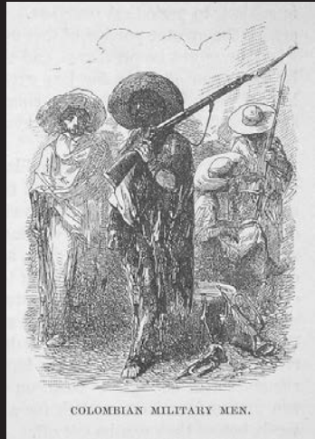
Colombian military men. Curtis, William Eleroy The Capitals of Spanish America. New York, Harper & Brothers, Franklin Square, 1888, pag. 233. Banco de la República, Colombia.