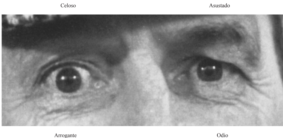
Figura 1. Muestra del test de los ojos de Baron-Cohen

La muestra estuvo compuesta por 34 personas de ambos sexos. De éstas, 17 padecen esquizofrenia de tipo paranoide, con un curso de enfermedad de cinco años o más desde el primer episodio psicótico y con edades comprendidas entre los 30 y 55 años. En el momento de administración de la prueba todos ellos habían sido debidamente informados sobre los objetivos de la investigación, ante lo cual se mostraron conformes y manifestaron expresamente su acuerdo en colaborar en ésta. Se encontraban estables, habiendo pasado largos periodos de tiempo desde la última crisis. Presentaban una adecuada conciencia de enfermedad y, por consiguiente, una correcta adherencia a la toma de medicación que, básicamente, se componía de neurolépticos. Participaban diariamente en el programa de ocio y tiempo libre de Anasaps (Asociación Navarra para la Salud Mental). Los 17 restantes constituyeron el grupo control, sin patologías, con edades dentro del mismo rango y equiparados en nivel sociocultural.