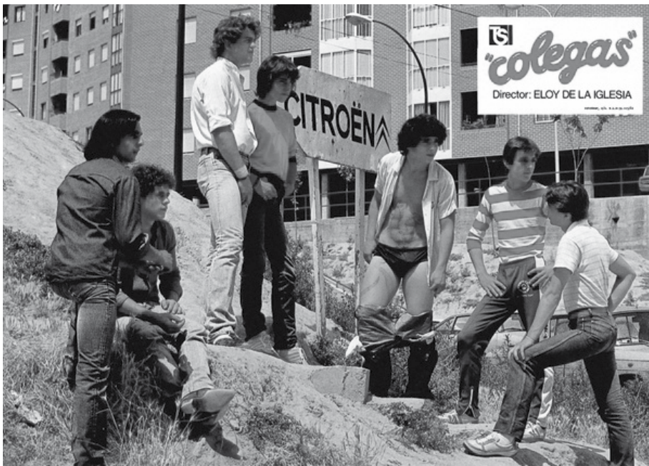
Fotograma de Colegas