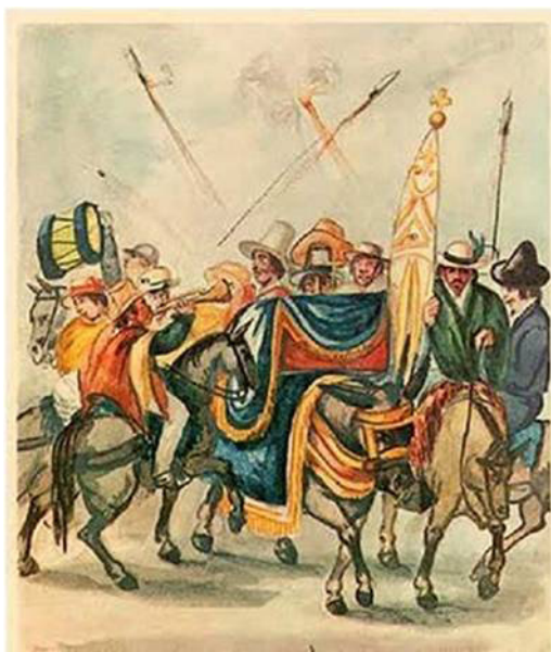
Ilustración 6.- Indios celebrando a un santo. Obsérvese los fuegos artificiales en la parte superior de la imagen.