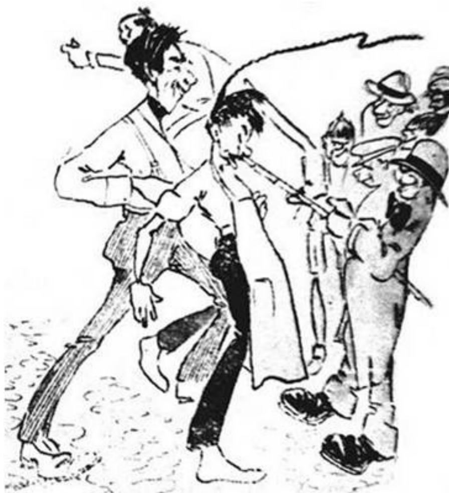
Ilustración 7.- La odiosa costumbre de golpear a los chinos con caña de carrizo siguió vigente en pleno siglo XX

Acabada la contienda, el Batallón Cuchara se disolvía y los asiáticos debían volver a su labor. Pero la más de las veces, los chinos sufrieron del maltrato de estos pillos. Si la policía nada hacía, Varietades (Ilustración 7) podía burlarse de la escena, como observamos a continuación. Nótese las diferencias numéricas y el modo del maltrato.