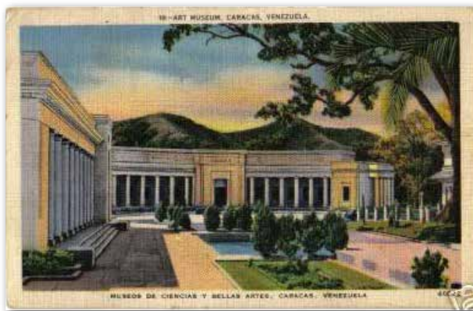
Museo de Ciencias y Bellas Artes. Caracas - Venezuela. Postal de época.

Junyent expone igualmente su punto de vista con respecto a la arquitectura cuando compara las viejas edificaciones, abundantemente ornamentadas, adaptadas para el uso de museos en Francia, Alemania, Inglaterra e Italia, con las nuevas construcciones más sobrias de Holanda y Estados Unidos, que obedecían a criterios más funcionales. El autor se detiene a revisar brevemente distintos tipos de museos: museo social , clasifica y estudia las diferentes manifestaciones de la vida colectiva; los primeros museos para niños , donde es presentada la evolución de la huma-