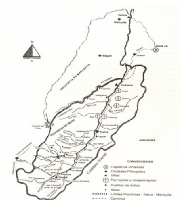
Figura 2. Mapa Provincias de Neiva y Mariquita