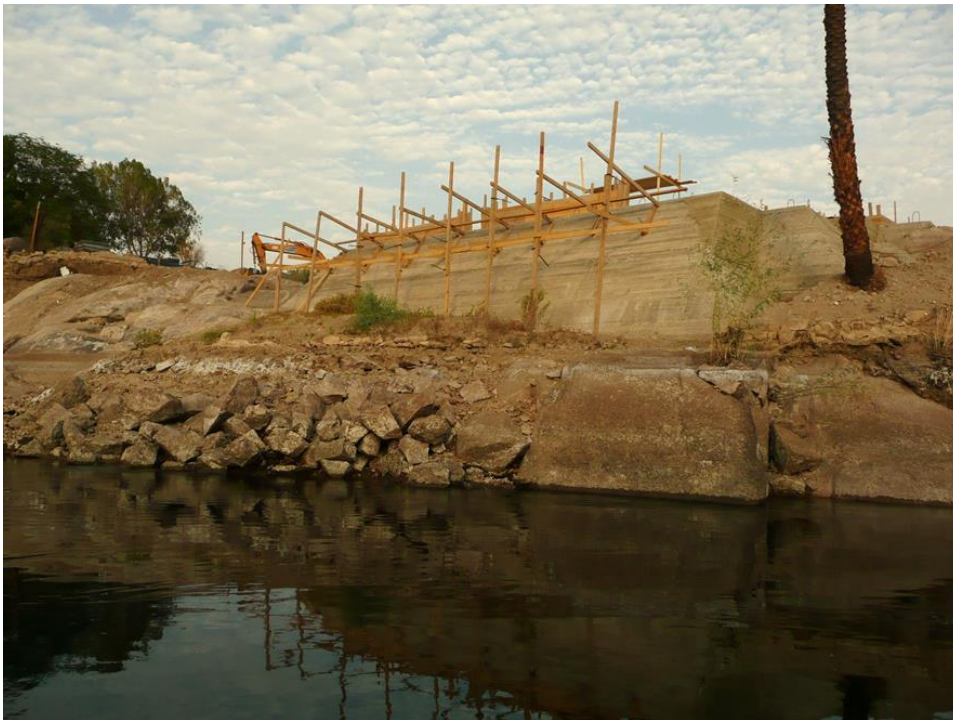
Construcción en el borde del cauce fluvial.