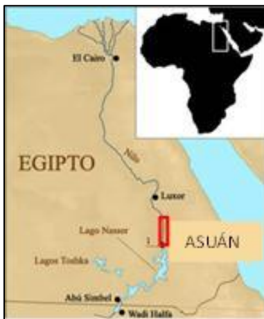
Localización del área de estudio

En el proceso de elaboración de la propuesta de parque patrimonial fluvial, hemos encontrado una serie de carencias destacables en la protección y en el mantenimiento de los bienes culturales existentes en este espacio. Quizá por falta de iniciativa, por ausencia de interés de las autoridades locales y regionales, por intereses creados, por falta de presupuesto para la conservación... o por un cúmulo de motivos, el caso es que nos encontramos un triste ejemplo de destrucción paulatina de este paisaje singular que se está deteriorando a un ritmo preocupante, debido fundamentalmente a la construcción de viviendas y alojamientos hoteleros que no respetan el diseño tradicional sino que copian otro tipo de arquitectura de corte más occidental (Figura 2).