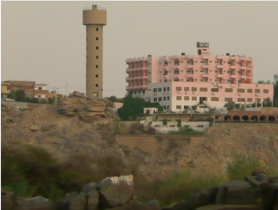
Alojamiento hotelero (Hotel Sarah) no integrado en el paisaje.