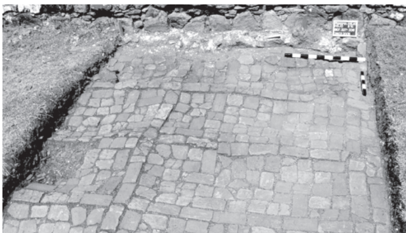
Figura 7. Piso de la nave mostrando las alteraciones y recolocaciones de los ladrillos.