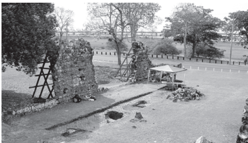
Figura 6. Piso de ladrillos de la nave de la iglesia.

haber tratado de un convento de dos pisos, a juzgar por el hallazgo de un cimiento que consideramos perteneció a las escaleras, y que parece haber sido perturbado por excavaciones realizadas en el pasado, de las cuales no tenemos informes. A unos 50cm al Este de la esquina Sudeste del cimiento de la escalera, se encontró parte de un muro de 84cm de ancho en dirección Norte-Sur. A tres metros al Este de este muro se halló otro, paralelo al primero, más angosto. Adyacente a él, se puso en evidencia un pequeño canal empedrado y un pavimento de cantos rodados, rasgos interpretados como parte de una calle exterior. La presencia de ambos muros, que se encontraron parcialmente demolidos, permiten inferir un proceso de ampliación del hospital hacia el oriente, realizado en dos etapas sucesivas. No se ha podido establecer, sin embargo, cuál fue el límite de esta extensión. Lo mismo puede decirse con respecto al patio, pavimentado con cantos rodados, del cual no se ha podido registrar arqueológicamente su límite oriental.