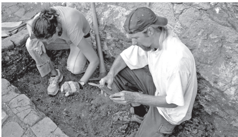
Figura 8. Trabajos de excavación. Temporada 2005.

iglesia. En el piso de la iglesia, en la sección Sur de la nave, se documentaron alteraciones y recolocaciones desordenadas de los ladrillos, las cuales han sido relacionadas con posibles enterramientos (Figura 7). Hasta el momento se investigaron dos de estas marcas de sepultura pero no se encontraron entierros intactos sino abundantes huesos, algunos conservando su orden anatómico (Figura 8).