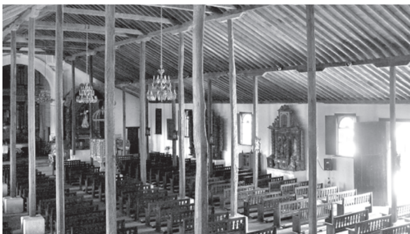
Figura 5. Interior de la Basílica de Santiago de los Caballeros, Natá, Pcia. de Coclé, Panamá.

cuya altura es demasiado reducida como para considerarla un vestigio de la construcción de un techo. Podría, sin embargo, estar relacionada con una primera etapa constructiva que incorporara una estructura de madera. Las paredes externas que aún se conservan, demuestran que se trataba de un edificio con una planta alta, tal como ocurre en los hospitales de Toledo y Sevilla. La parte Norte del edificio de la iglesia estaba separada del resto por una pared transversal y poseía una entrada en el ala Norte. Directamente en el Sur de esta pared divisoria se encontraba el altar principal de la iglesia. El área del altar, a la que seguramente se accedía por escalones, ocupaba todo el ancho de la nave central. Dos podios a los lados servirían como altares secundarios o como la sillería de la pequeña comunidad de los monjes. La nave de la iglesia poseía un piso de ladrillos (Figura 6). Directamente frente al altar se puede observar una depresión en el suelo, para la cual no se ha hallado aún una explicación definitiva, pero que no está asociada con actividades funerarias, según lo observado arqueológicamente.