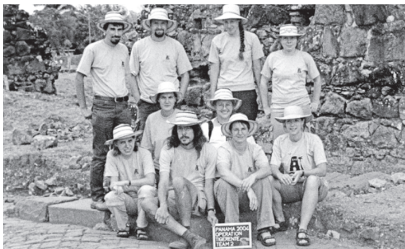
Figura 2. El equipo de arqueología, temporada 2004.

Alemana de Investigaciones), la DAAD (Servicio Alemán de Intercambio Académico), la Universidad de Tübingen y donaciones privadas de Panamá. Fueron además puestos a disposición $30,000 por el BMZ (Ministerio de Cooperación Económica y Desarrollo) de la República de Alemania, para la mejora de la infraestructura técnica del departamento arqueológico del Patronato. La embajada alemana en Panamá contribuyó con la logística para lograr un trabajo exitoso.