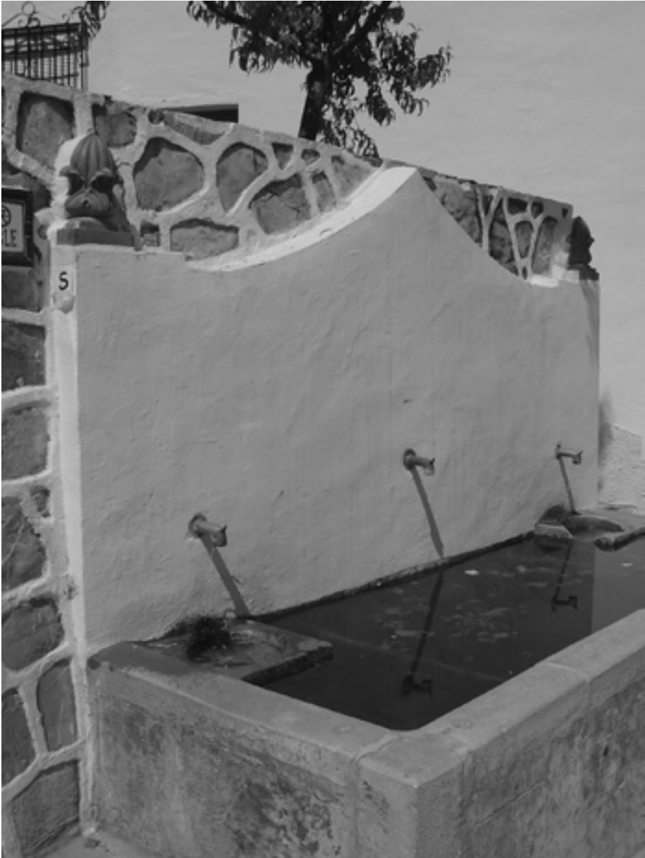
4. Fuente del Alamillo.