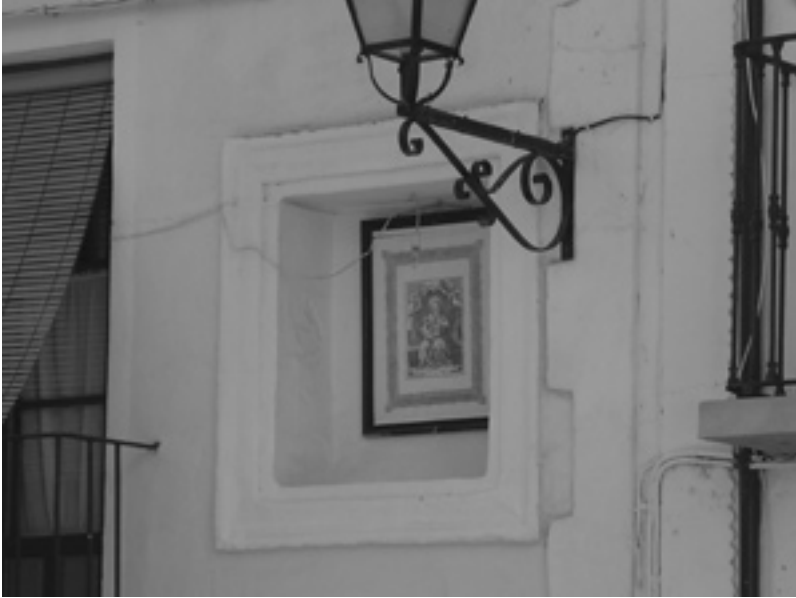
1. Capilla callejera