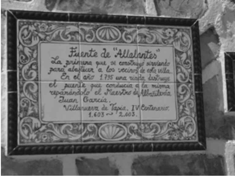
6. Panel informativo de la fuente del Alamillo.