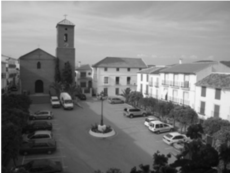
7. Plaza de España.