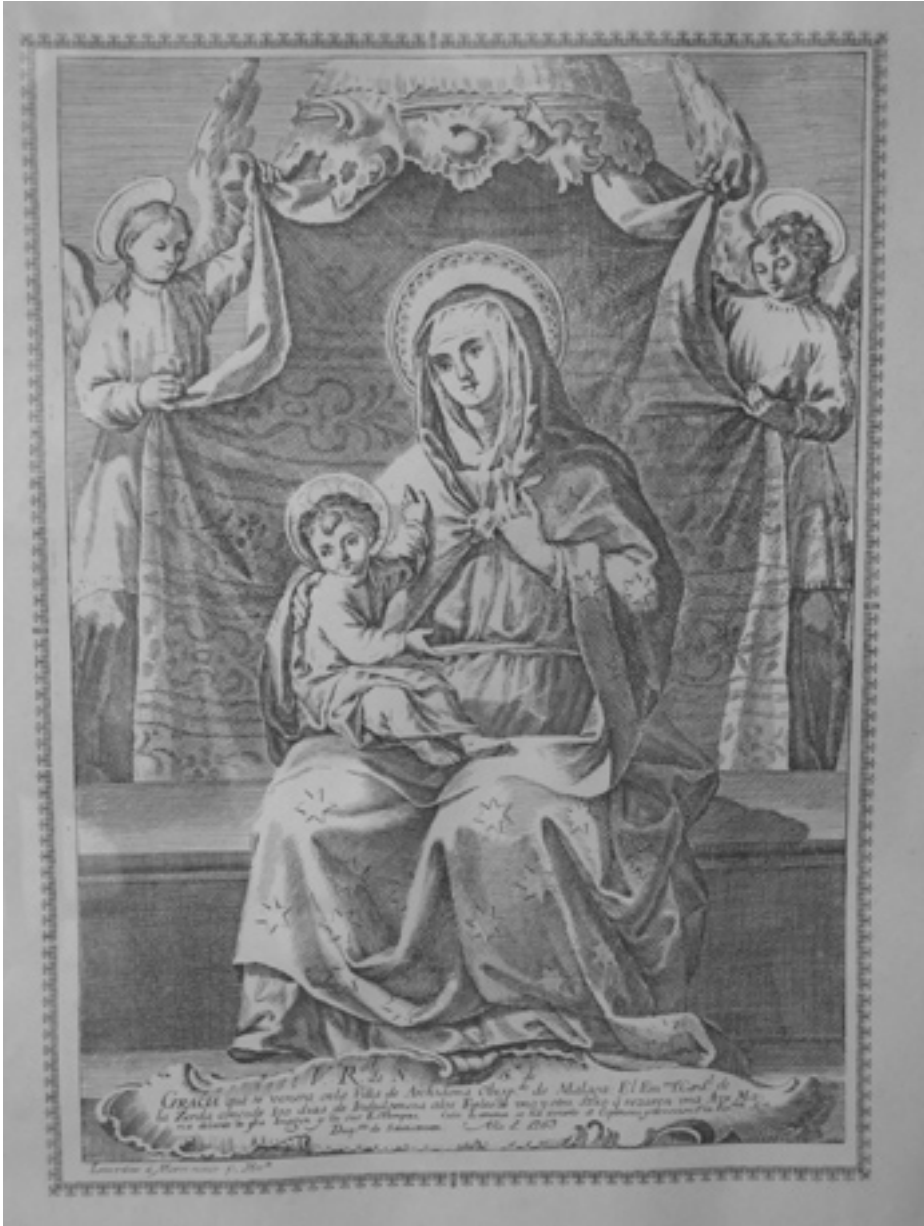
3. Estampa de la Virgen de Gracia emplazada en una capilla callejera.