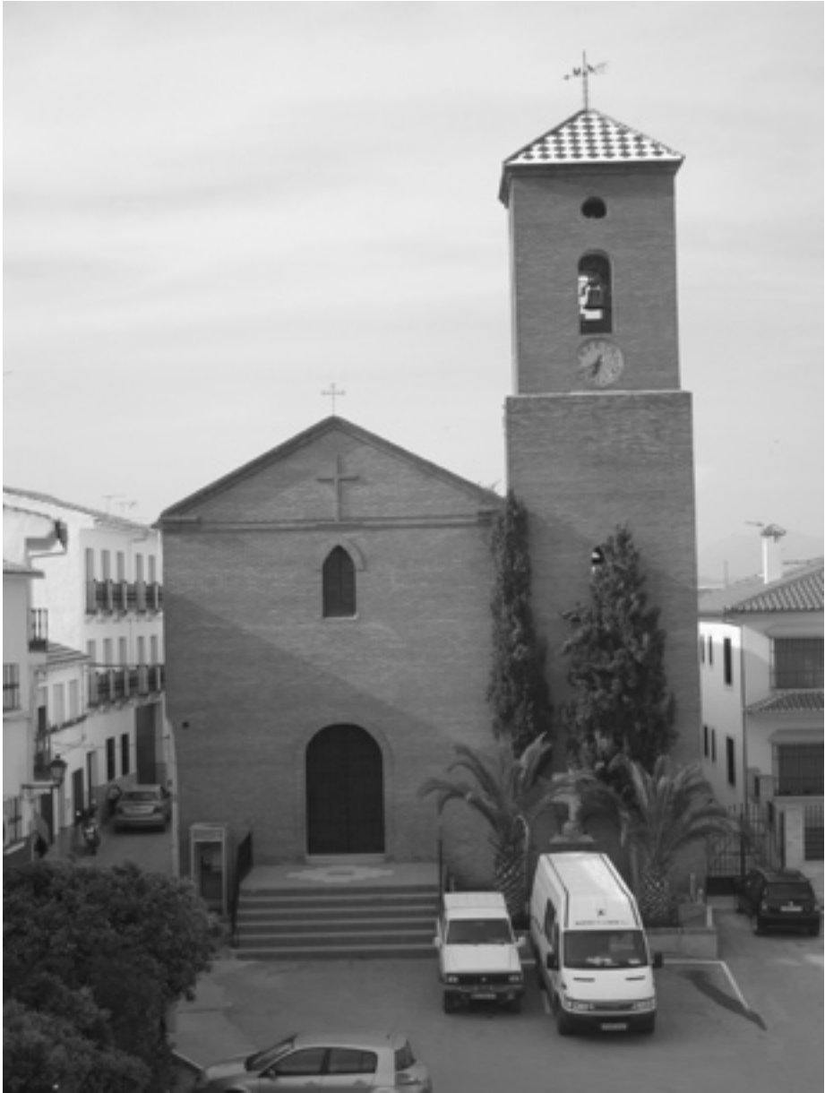
5. Iglesia parroquial.