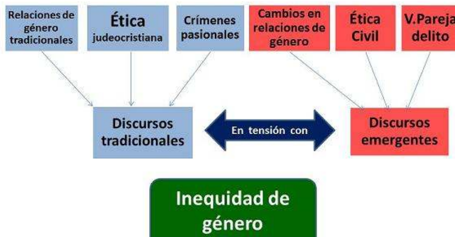
Figura 5. Contexto explicativo sociocultural

En el contexto económico, la división sexual del trabajo tradicional aunada a la concepción mercantilista neoliberal predominante, hace que las personas consideren que los derechos, el poder y la autoridad se derivan de los ingresos monetarios. Así algunas mujeres, como Jenny, justifican su tolerancia a la violencia, por su falta de autonomía laboral y económica,