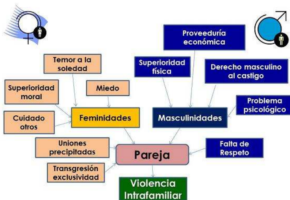
Figura 2. Representaciones sociales sobre las masculinidades y feminidades

La figura 2 representa la interpretación gráfica que se efectuó de las categorías en las cuales se sustentan las representaciones sociales, que sobre las masculinidades y las feminidades comparten en sus discursos, las personas que fueron entrevistadas. Ellas y ellos afirman que estas concepciones se ciernen como presiones en sus relaciones y propician la violencia que clasifican como intrafamiliar. De esta forma, tales representaciones les sirven de guía en sus acciones, a la vez que son empleadas para justificar sus comportamientos respecto a la violencia en las relaciones de pareja.