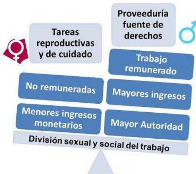
Figura 6. Contexto explicativo económico

En el contexto político la dominación masculina es la condición estructural identificada en relación con el poder no sólo político sino también social y jurídico. Esta categoría emergió en la revisión historiográfica, a partir de categorías como el derecho masculino al castigo; en los discursos publicados en la prensa regional donde se presenta a los hombres con mayor poder de decisión colectiva política; así como en la categoría de poder asimétrico entre hombres y mujeres, encontrada en los discursos recopilados mediante las entrevistas y los grupos focales. En las representaciones sociales que hacen visible estas asimetrías de poder se pueden incluir la incipiente construcción de autonomía política femenina y el desconocimiento de los derechos de las mujeres, por amplios sectores de la población, lo cual incluye a algunos de los mismos profesionales intervinientes.