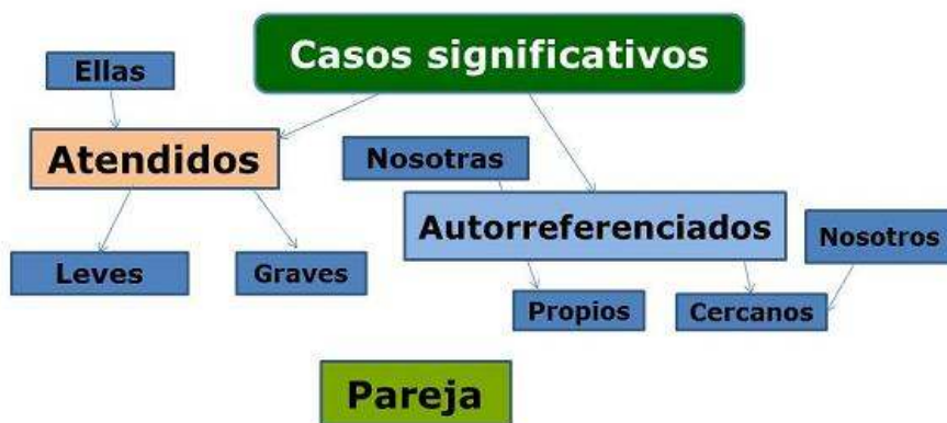
Figura 3. Representaciones sociales sobre casos significativos

La representación gráfica de la red o network sobre los casos significativos y su relación con las y los profesionales intervinientes se esquematiza en la figura 3. De las declaraciones respecto a estos casos significativos se derivaron los códigos y categorías que permitieron comprender representaciones centrales para el problema en estudio como la representación de pareja. Al respecto, es llamativo que en una región con un ascendiente católico tradicional tan marcado, circulen entre diferentes grupos como los de algunos profesionales intervinientes, representaciones polémicas en las cuales la heterosexualidad no es la única opción para las parejas, bien sea que quieran o no conformar familias. Asimismo la convivencia de la pareja bajo el mismo techo también se considera electiva, aunque tengan hijos en común (Ariza, 2012).