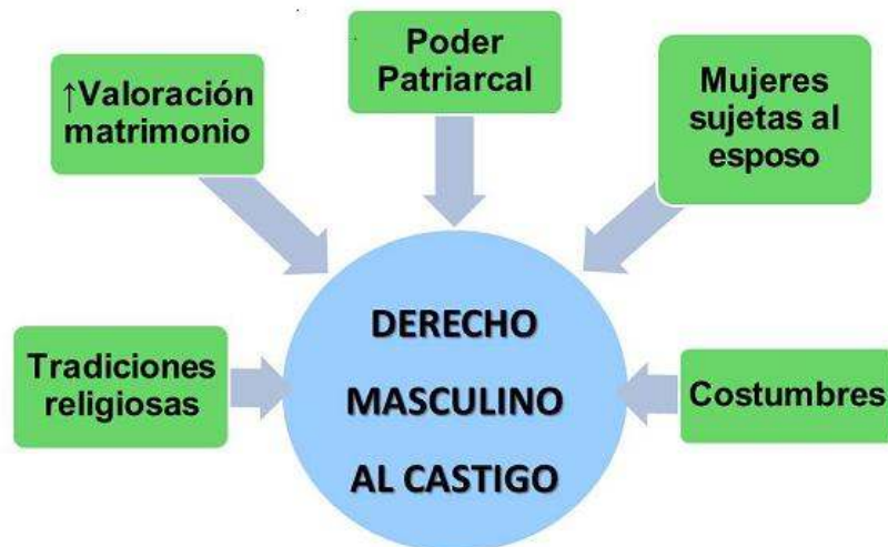
Figura 1. El Derecho masculino al castigo de la mujer

de una moral y que podían llevar sin mucho esfuerzo incluso a los santos varones a la tentación y al pecado como aducía San Agustín de Hipona (Cancelas et al., s.f.). En la figura número 1 se presenta un esquema del análisis de la constitución histórica de esta categoría del derecho masculino al castigo de la mujer, el cual, de acuerdo a la revisión efectuada, se sustentaba en las tradiciones religiosas ibéricas (tanto cristianas como musulmanas), en la alta valoración social que se daba al matrimonio especialmente para las mujeres, en el poder patriarcal de los hombres, supuestamente derivado de la deidad y en las tradiciones patriarcales mencionadas que justificaban que las mujeres en el matrimonio, estuviesen siempre sujetas a la voluntad de su esposo.