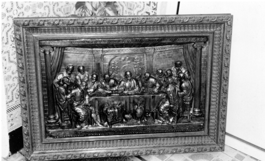
Figura 4. Relieve de la Santa Cena. Colección particular. Tomares (Sevilla). Atribuido a La Roldana.

vano en forma de arco de medio punto, peraltado, probablemente de una ventana, por el que se ve un rompimiento de gloria, y que es más probable que estuviera en un piso alto.