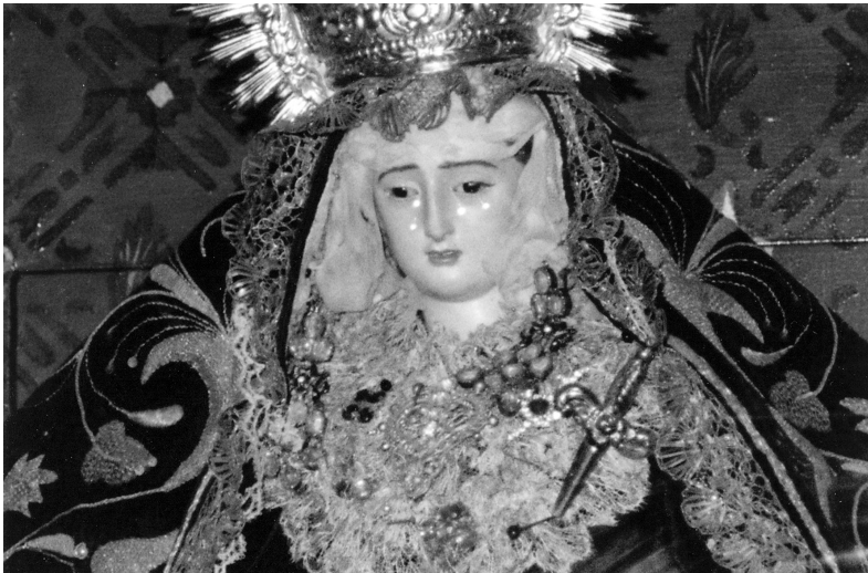
Figura 3. Nuestra Señora de los Dolores. Colección particular. Sevilla. Atribuida a La Roldana o a algún discípulo suyo.

Es de pequeño tamaño y está dentro de una urna que figura un paso de palio, hecho en madera oscura. No sabemos si estuvo en el interior de esta urna desde que se hizo, o si la urna es posterior y se la pusieron al comprarla para prevenirla del polvo y suciedad. Estas imágenes pequeñas son muy características de La Roldana, que las hizo desde muy joven para venderlas. No está articulada, es de madera con ojos de cristal. Está de pie con las manos crispadas al estilo sevillano. Es de Candelero, destaca por su finura de sus manos en una de las cuales, la izquierda, llevaba un pañuelo. Su cara muestra una belleza barroca, con boca pequeña, nariz recta y ojos algo achinados. Su mirada es baja, extiende su brazo derecho como para proteger a alguien. Lleva cuatro lágrimas y no porta peluca. Perteneció a una tía abuela de su actual propietaria que se llamaba junto con su hermana D a Trinidad y D a Josefa Díaz.