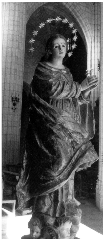
Figura 2. Inmaculada Concepción. Patrona de Morón de la Frontera (Sevilla). Iglesia de San Miguel Arcángel. Atribuida a La Roldana. S. XVII-XVIII.

La segunda de las Inmaculadas atribuida a Luisa Roldán es la patrona de Morón de la Frontera (Sevilla), que se encuentra en la Iglesia de San Miguel Arcángel de esta localidad sevillana, corrientemente en la capilla sacramental, aunque a veces la trasladan al altar mayor, para diversos cultos. Ha sido fechada en la primera mitad del siglo XVIII, aunque también puede ser de fines del XVII.