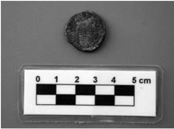
Figura 2.- Semis de Iulia Traducta.

tanto, si Estrabón se valió de estos autores para su descripción de la costa norte, es lógico que no apareciera la ciudad de Traducta entre sus hitos poblacionales; sin embargo, si narra la existencia de la ciudad de Iulia Ioja , la Iulia trasladada , a la orilla norte.