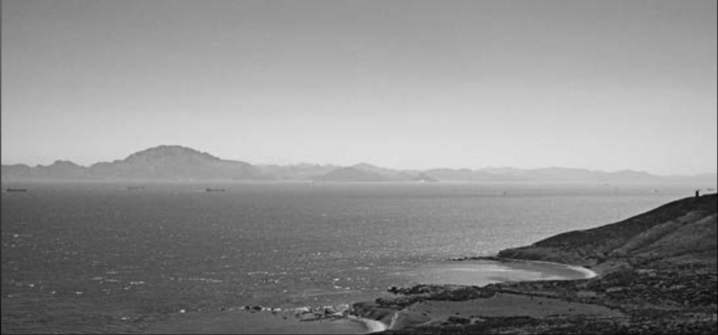
Estrecho de Gibraltar.