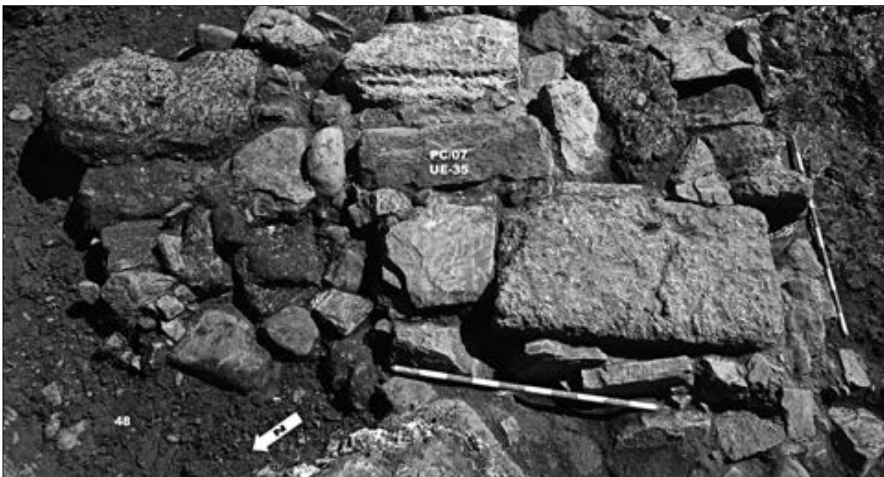
Figura 5.- Estructura funeraria.