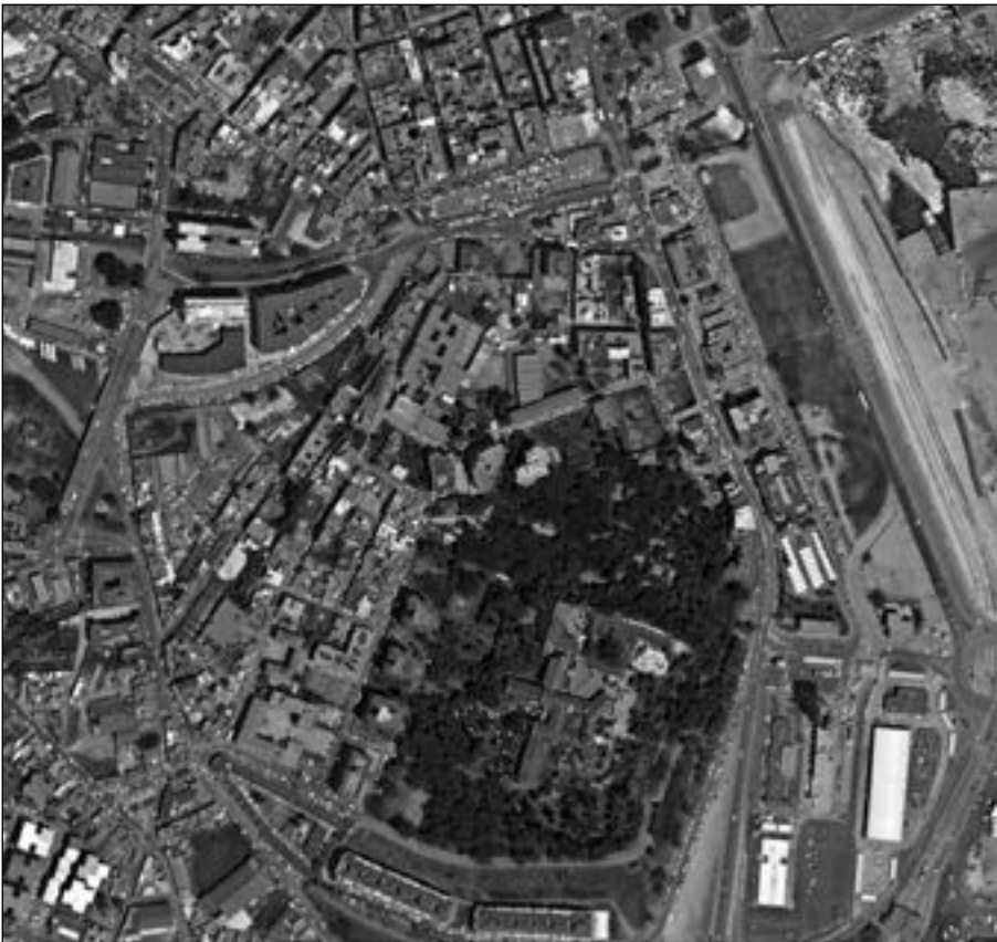
Figura 4.- Tomada de Google Earth retocada por el autor.

nombraría a dos ciudades distintas: Tingi y la otra Tingi . La ciudad trasladada de Estrabón sería la ciudad de Tingi y haría referencia a los pobladores tingitanos con ciudadanía romana que fueron asentados en la orilla norte del Estrecho por Octavio. No obstante, del texto de Estrabón se infiere que el traslado principal se lleva a cabo con los habitantes de Zilis a los que suma un contingente de tingitanos. Y aquí entra de lleno la noticia transmitida por Mela al indicarnos que su ciudad está habitada por fenicios trasladados desde África. La relación entre los dos textos es bien patente: la ciudad que Mela llama Tingentera (si aceptamos dicha lectura) no puede ser otra que la ciudad poblada por africanos trasladados que recibió el nombre de Iulia Iozza en la Geografía de Estrabón. Pomponio Mela, oriundo de la ciudad no pudo confundir a los tingitanos con africanos pues estos ya eran ciudadanos romanos desde época de Octavio; sin embargo, en el nombre de la ciudad, la vinculación es con Tingi y no con Zelis por lo que creo que al hablar Mela de habitantes de África en su ciudad (fenicios africanos dice) no se refería al componente ciudadano de la