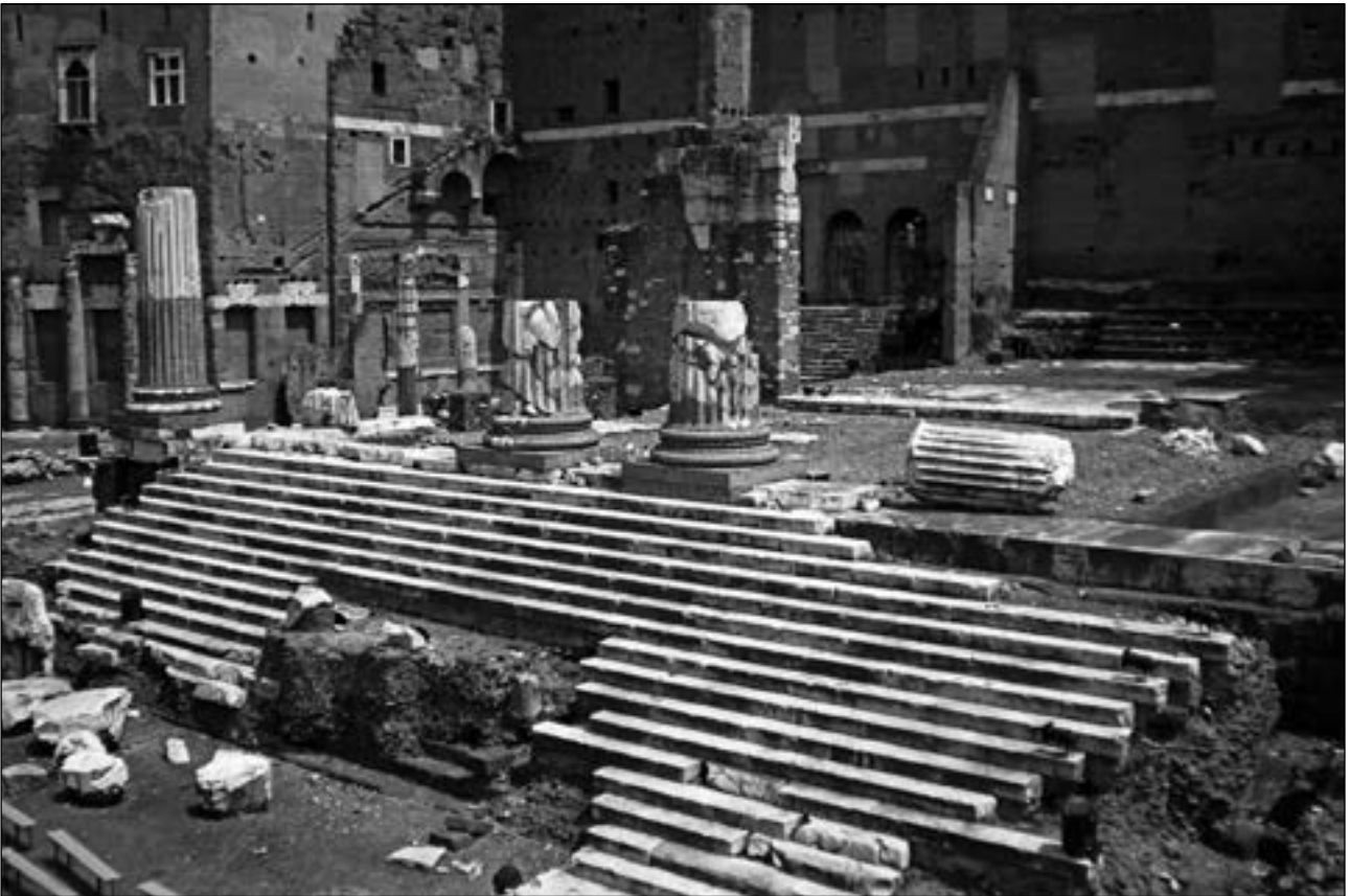
Figura 1.- Templo de Mars Ultor.

Previamente, ha descrito la bahía de Algeciras donde indica que se encuentra la ciudad de Carteia, de la que dice que según Timóstenes, se llamó antiguamente Heracleia y no describe nada más hasta llegar a Mellaria 3 .