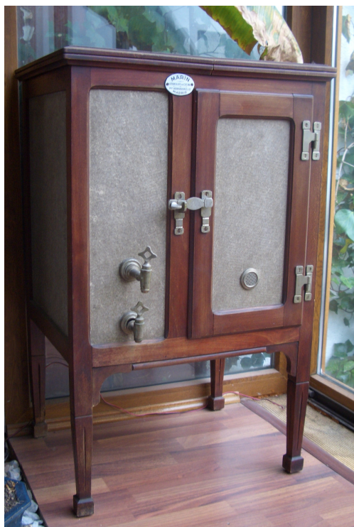
Fig. 6. Nevera de la Casa Marín

En el lado derecho, encontramos el habitáculo para la comida, está recubierto de zinc en su interior y tiene una doble función: la de proteger la madera y la de aislante, para que los alimentos duren más tiempo fríos. Estaba dividido en tres espacios horizontales, donde debían ir las baldas que servían de estantes. La pared que se une con el depósito del hielo presenta unos agujeros, que permitían que el frío pasara de un lado a otro. Además encontramos dos elementos de ventilación: uno en la puerta y el otro en el lateral derecho del mueble. Esta puerta lateral se une al mueble por medio de dos bisagras y se cierra gracias a una especie de pestillo.