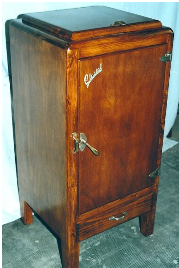
Fig. 4. Nevera de la marca “ La Glacial ”

En 1916-17, el militar, Eduardo Aristoy, crea “ La Glacial ”, patentando un mueble-nevera higienizado (Nº: 63306). El modelo es una especie de armario de caoba, cuyo ensamble nos presenta un bastidor que divide en dos mitades al cuerpo bajo: la de la izquierda alberga el depósito de hielo, que es de hierro esmaltado, y el de la derecha, la cámara frigorífica; todo ello descansa sobre cuatro pies. Las paredes se revisten con una delgada capa de zinc, que estabiliza la atmósfera aisladora. Se embute un grifo que sobresale de la cara del mueble. Un tubo recorre la puerta, que sirve para la admisión de aire que atraviesa todo el espesor. En la parte más alta de la pared del fondo y a la derecha está el tubo de expulsión, que desemboca en la parte trasera, que asegura la ventilación. La pared interna de la cámara es la misma del depósito de hielo contiguo, con anchos orificios de comunicación. El grifo y el depósito están unidos por un tubo rígido en ángulo recto, que se une al serpentín que queda sumergido en el agua del deshielo. El desagüe del deshielo sale por un tubo atornillado al fondo, que se abre por medio de una llave que sobresale por el suelo del mueble y está oculta de la vista por un armazón en el cuerpo bajo. (Fig. 4)