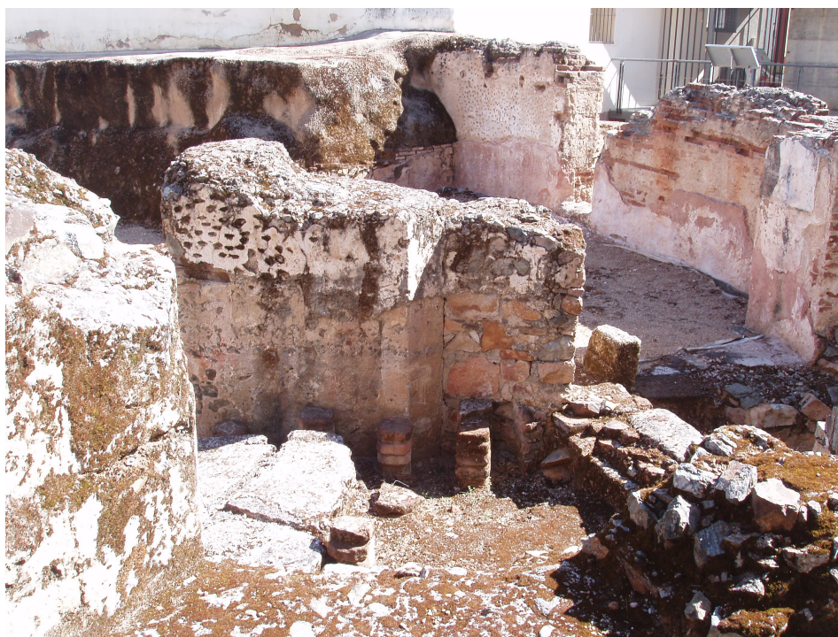
Fig. 1. Pozo de Nieve Artificial de época romana (Mérida)

Los neveros de almacenamiento, se sitúan en las depresiones del terreno, en su mayoría se aprovechan los neveros naturales; en ellos se introduce la nieve compactándola hasta convertirla en hielo y cubriéndola con ramas para conservarla, se les daba el nombre de pozos de nieve. No será hasta el siglo XV cuando nos encontremos con los primeros neveros artificiales, se construían orientados al norte y para aprovechar las temperaturas más bajas, se dividían en dos partes: pozo y cubierta. Lo normal era que se aprovechara la orografía del terreno, por lo que su estructura arquitectónica podía variar, por este motivo se excavaban unos pasillos que permitieran llegar hasta la zona donde se encontraba el hielo 2 . Otra opción era la construcción a ras de suelo, para lo que se añadían unas escalerillas que facilitaban el descenso al fondo desde la parte superior, donde nos encontramos la cubierta, que podía ser plana o abovedada, por la que se introducía la nieve. Además de por la cubierta, se accedía al hielo por una abertura lateral. (Fig. 1)