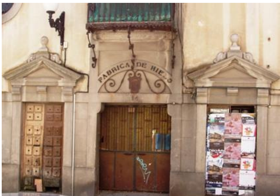
Fig. 2. Fachada de la Fábrica de Hielo en Ávila

En el siglo XIX, debido al cambio climático y al desarrollo de la medicina, se condenó el uso de hielo natural por lo que proliferaron las instalaciones para fabricar hielo industrial, y los pozos de nieve fueron desapareciendo 7 . (Fig. 2) La primera fábrica de hielo en España, la encontramos en Madrid, en la segunda mitad del XIX. A finales de los 80 se instala la fábrica de cervezas Mahou que además de producir cerveza, también produce hielo y en 1903 sucederá lo mismo con Cervezas El Águila 8 .