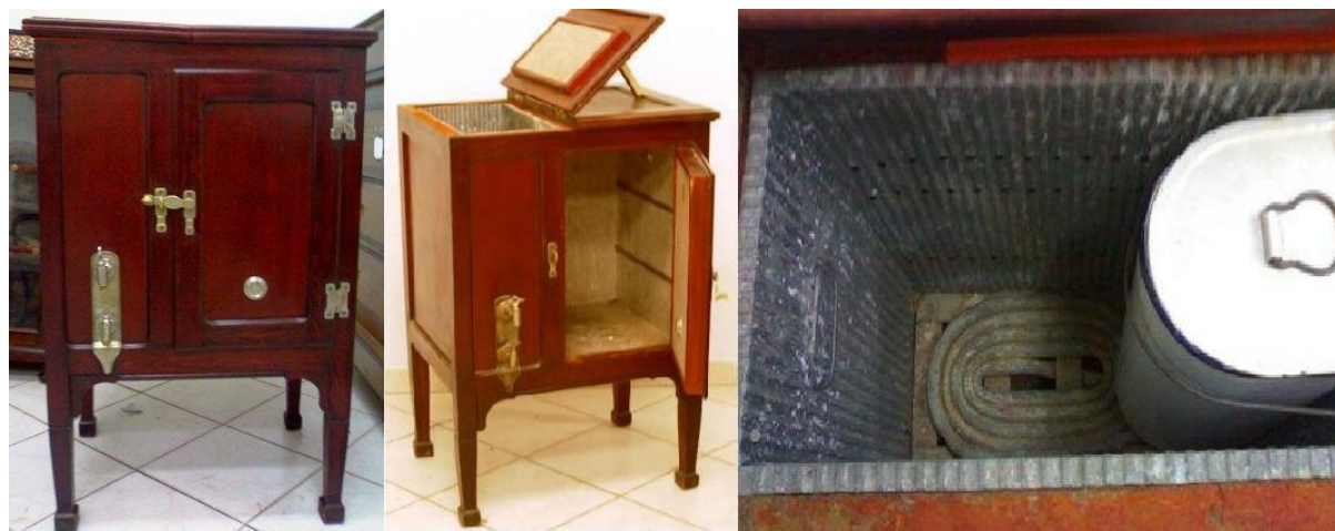
Fig. 5. Nevera restaurada por Arcaz. Vista cerrada, abierta y del depósito de hierro que contenía la barra de hielo.

Hemos de decir que también llegaron a la Península marcas de otros países como la italiana Frido y la americana Apex (1931)