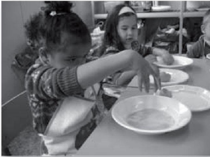
TALLER DE CUINA

matemàtic, musical..., i puguin desenvolupar la creativitat.