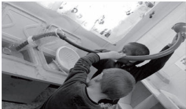
Un infant competent, curiós, actiu, ple de potencialitats