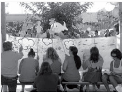
Pares fent una representació teatral en la festa de l'estiu 2010