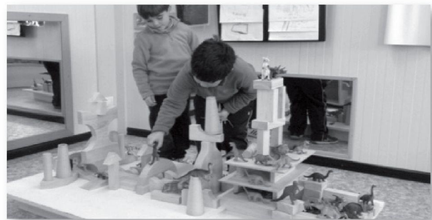
TALLER DE LES CONSTRUCCIONS