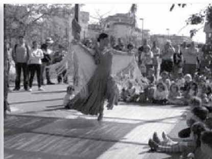
Actuació de ball espanyol d'una mare en la festa de l'estiu 2011