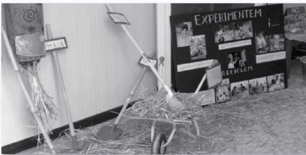
TALLER DE L'HORT