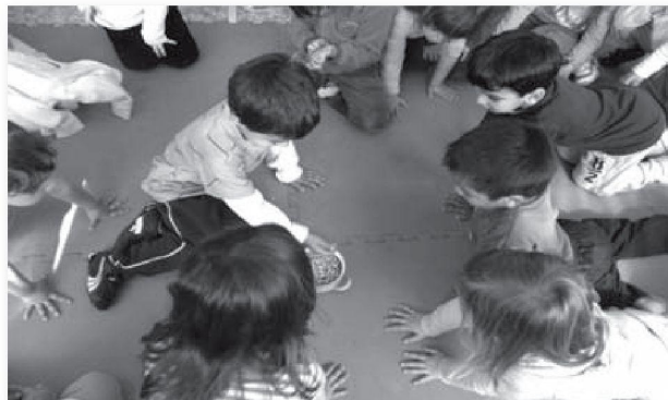
Un infant que és l'eix de tot el procés d'aprenentatge