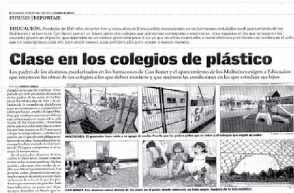
19 de juny de 2010

Posar en marxa un centre de nova construcció en les condicions de l'estructura prefabricada ha estat un repte que hem anat desenvolupant paral·lelament al nostre projecte pedagògic.