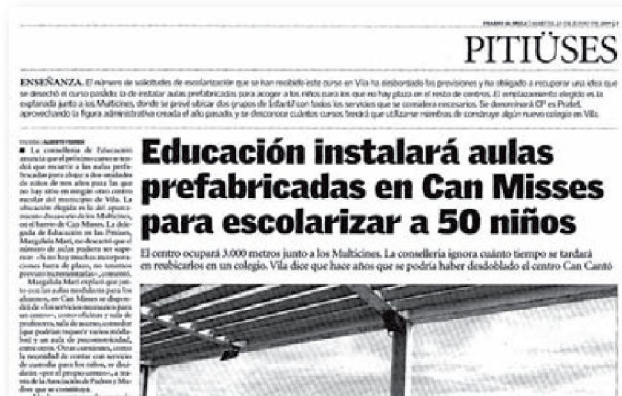
23 de juny de 2009

La feina que va fer l'equip de mestres amb professionalitat i il·lusió féu possible engegar un projecte educatiu de qualitat, encara que periòdicament fos notícia a la premsa.