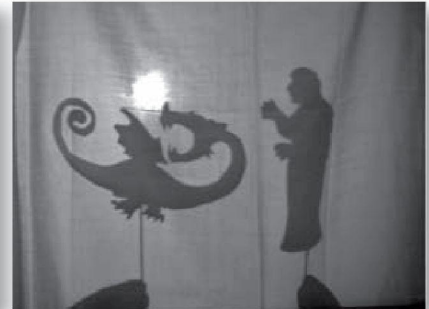
TALLER DE CONTES