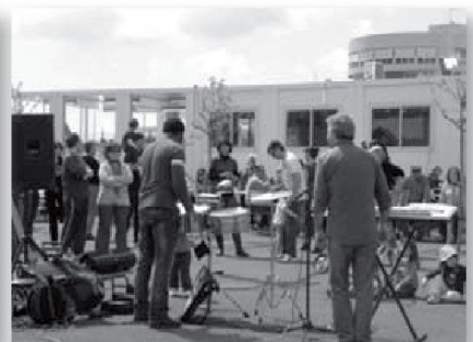
Col·laboració musical d'un pare en la Festa de la Primavera 2009