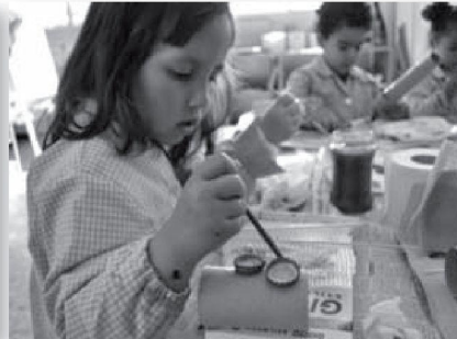
TALLER DE L'ART