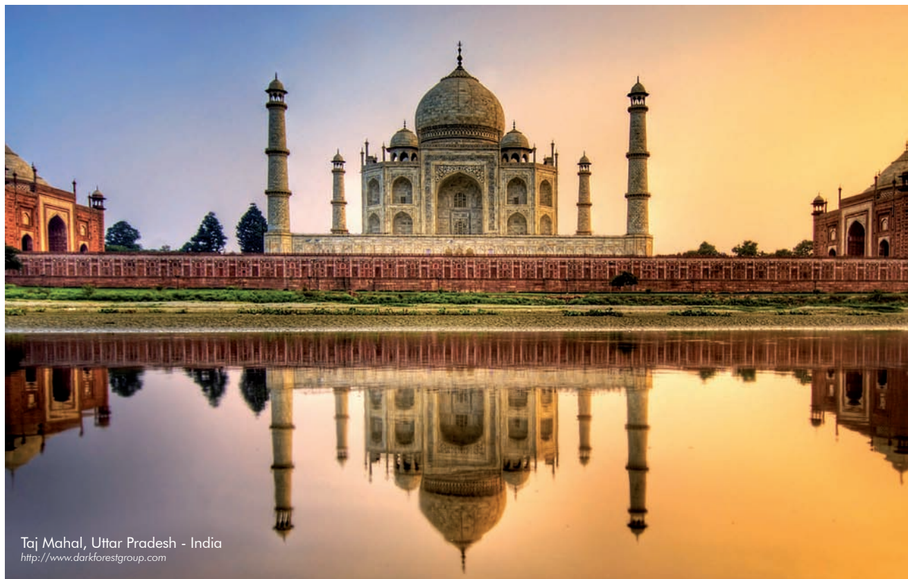
Taj Mahal, Uttar Pradesh - India

La Calidad Académica, un Compromiso Institucional