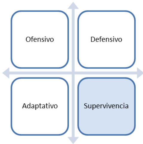
Figura 2 Posicionamiento de la Facultad de Ciencias Económicas e Informáticas

Teniendo en cuenta las valoraciones realizadas por los miembros del Consejo Científico que participaron en el ejercicio del diagnóstico, es posible concluir que la Facultad objeto de estudio se encuentra en un posicionamiento de supervivencia, respecto a la gestión de proyectos de colaboración económica internacional, como se aprecia en la figura 2