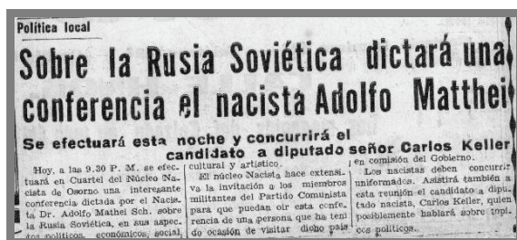
Imagen n.º 3. El diario “La Prensa” de Osorno informa sobre próxima conferencia del nacista Adolfo Matthei en la ciudad.