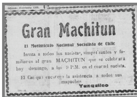
Imagen n.º 5. Convocatoria del MNS a “Gran Machitún” en Osorno.

hicieran de Chile un país alegre y optimista y que hoy casi se ha olvidado para dar cabida a la música arrabalera y cadenciosa de países extranjeros”. 66 Este tipo de reuniones no sólo tenían como objeto la distracción, sino también convocar más adeptos en la zona, tal como lo indica el diario en los últimos días de febrero de 1937, cuando señalaba que, “este machitún también estará rodeado de una solemnidad especial debido a que los nacistas ingresados últimamente prestarán su juramento de fidelidad a la causa”. 67 En definitiva, con este tipo de particulares manifestaciones el nacismo en el medio local ya comenzaba a cerrar una tempranera y agitada campaña, de acuerdo con lo verificado en la prensa escrita local. Esperaba aguardar entonces para el MNS la víspera de las elecciones y su posterior desenlace, el cual podía coronar o castigar su esfuerzo desplegado.