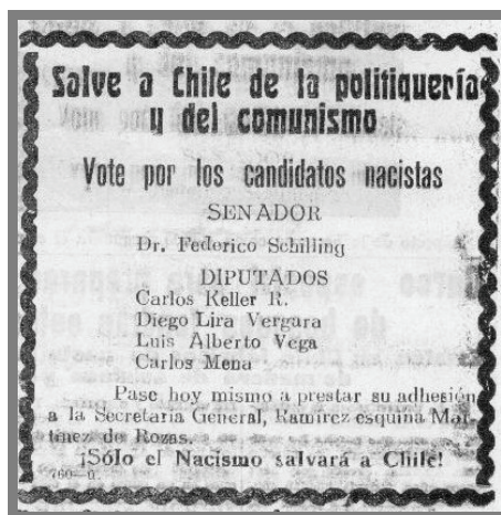
Imagen n.º 4. Propaganda política en el diario “La Prensa” de Osorno que llamaba a votar por los candidatos del MNS.

El segundo elemento claramente apreciable de la propaganda nacistá en el diario local estuvo representado por el sentido contestatario de ésta, siendo frecuente hallar en su discurso expresiones de ataque y defensa, la mayoría de las cuales tenían como blanco el Frente Popular. Los mismos integrantes del MNS reconocían que se habían servido permanentemente de su tribuna en “La Prensa” con tales fines: “Desde las columnas de la “Página Nacista” de este diario hemos venido sosteniendo incesantemente que el verdadero peligro para nuestra patria está actualmente en el Frente Popular, por su combinación política de carácter netamente comunista” . 52 El MNS en este medio sostenía que la izquierda chilena era parte de una confabulación internacional, la cual había actuado en Rusia y causaba por aquellos días los males de la revolución en España. Los nacistas difundían en el diario de Osorno informaciones como la citada a continuación, la cual refleja claramente su posición: “En la bolsa negra de Santiago, según informa la prensa, se han estado vendiendo numerosas letras y cheques procedentes de Montevideo, que estarían destinados a costear los gastos electorales de los candidatos bolcheviques” . 53 La nota sentenciaba finalmente que: “Es necesario pues, unirse en un frente anti-comunista para defenderse de la hidra roja y evitar que este país pase a ser una factoría de Moscú” . 54