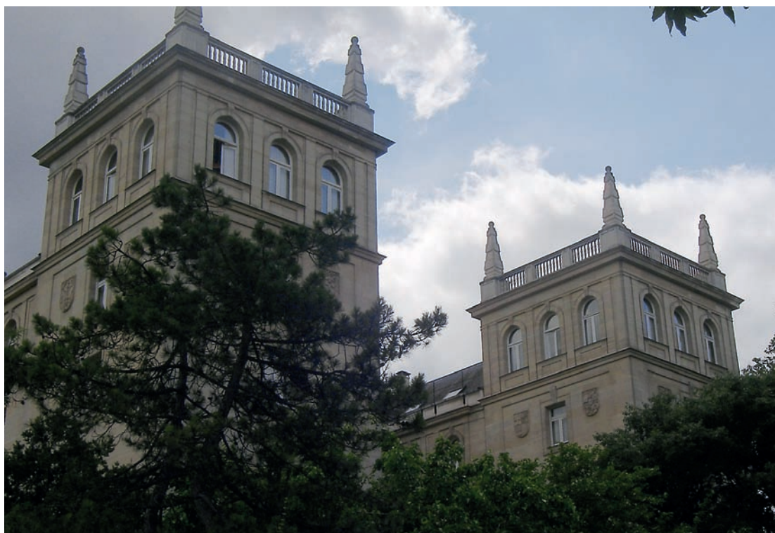
Fig. 6. El Colegio de España, las torres como emblema simbólico del Colegio.

en el proyecto, dando tono severo al edificio y austeridad a su decoración. La personalidad del edificio reside en sus torres, versión moderna de las de Monterrey (figura 6). “El Colegio de España —se escribió 26 — se refiere en su concepción a la tradición universitaria española de los siglos XVI y XVII. La coronación de sus cuatro torres ilustra dicha referencia”.