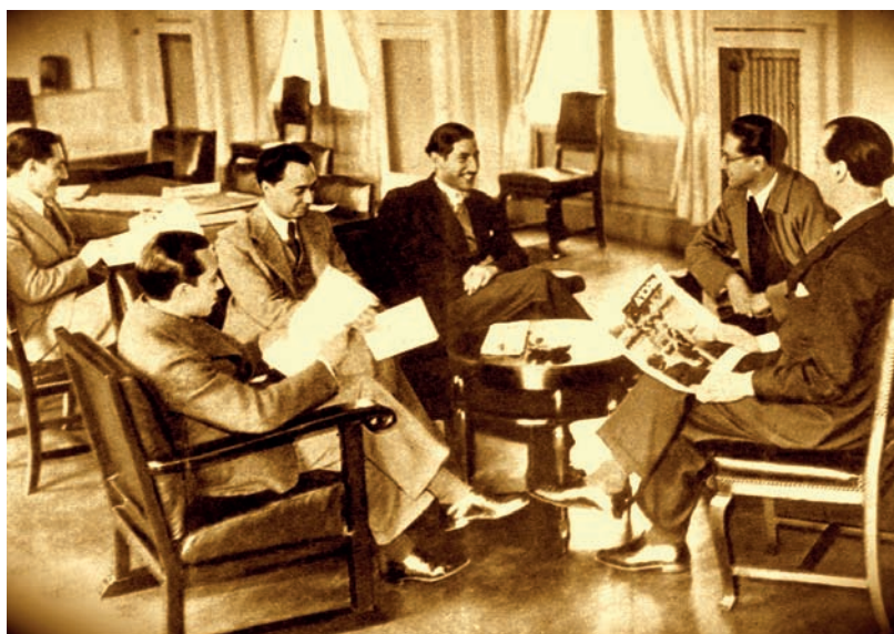
Fig. 7. El Colegio de España, foto de grupo de residentes h.1935.

en los medios franceses y, adaptado a ellos, se sometió a subasta para la contratación, dando comienzo a las obras en septiembre de 1929.