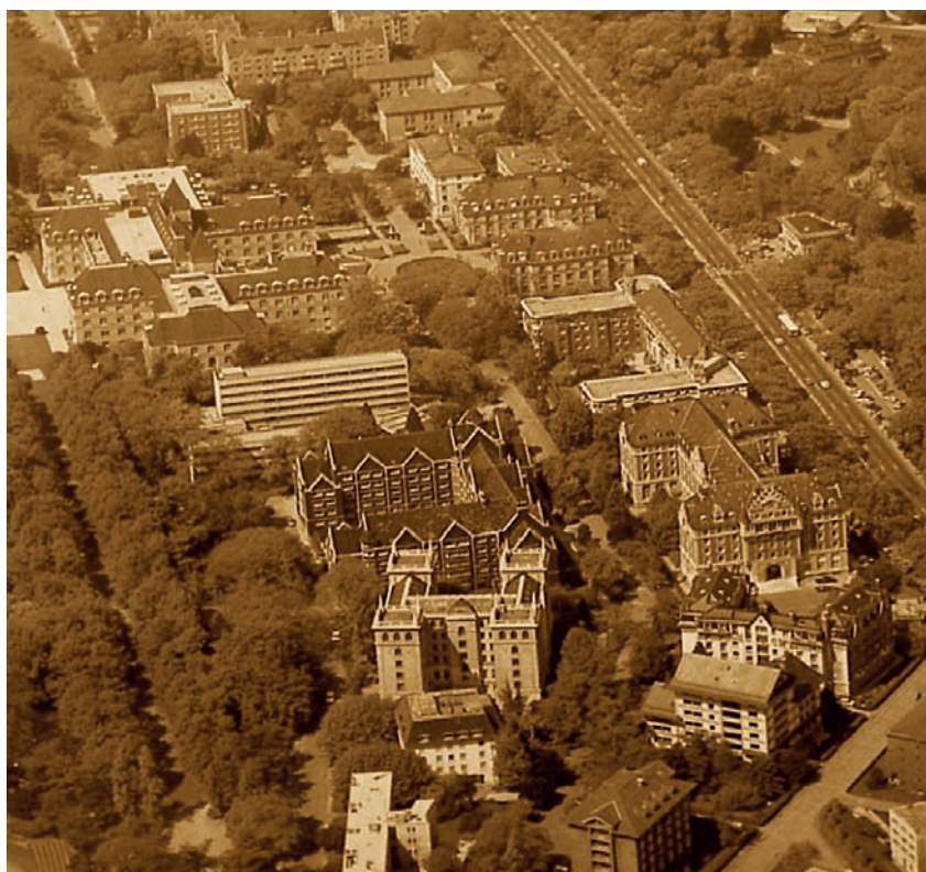
Fig. 4. El Colegio de España, volumetría mostrando su inserción en la Cité.

portantes están ya representados”. “El propósito –se dijo– es que la Casa del Estudiante Español sea capaz para 70 u 80 huéspedes, de los cuales 60 podrían ser muchachos que cursaran allí sus estudios y 20 hombres de carrera que fuesen a ampliar sus conocimientos”.