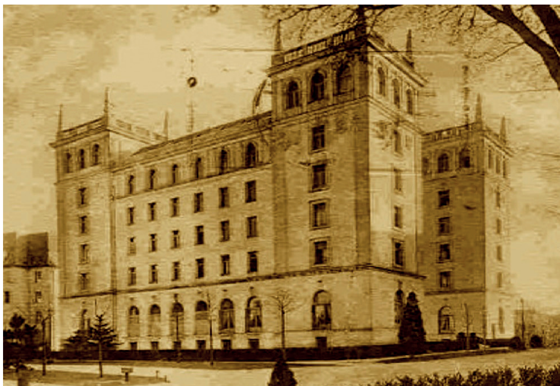
Fig. 5. El Colegio de España, foto perspectiva h.1935