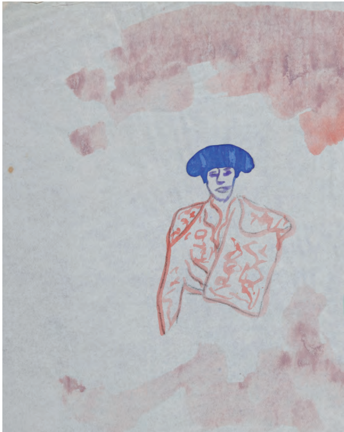
Yves Klein, dibujo sin título, acuarela sobre papel, 26,8 x 21 cm, 1951. © VEGAP, 2009