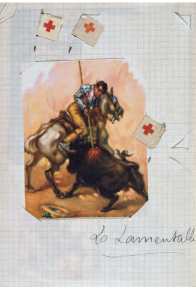
Yves Klein, Diario de España , Madrid, 1951

la última la manera de atacar. La fuerza de las tentaciones o el espíritu del mal se puede comparar a la electricidad en sus utilizaciones industriales; es decir, que es una fuerza que mueve algo o que empuja a una persona o a un animal con un impulso lento, dulce, pero poderoso, y sobre todo continuo. Además todas las fuerzas de la naturaleza obran así.