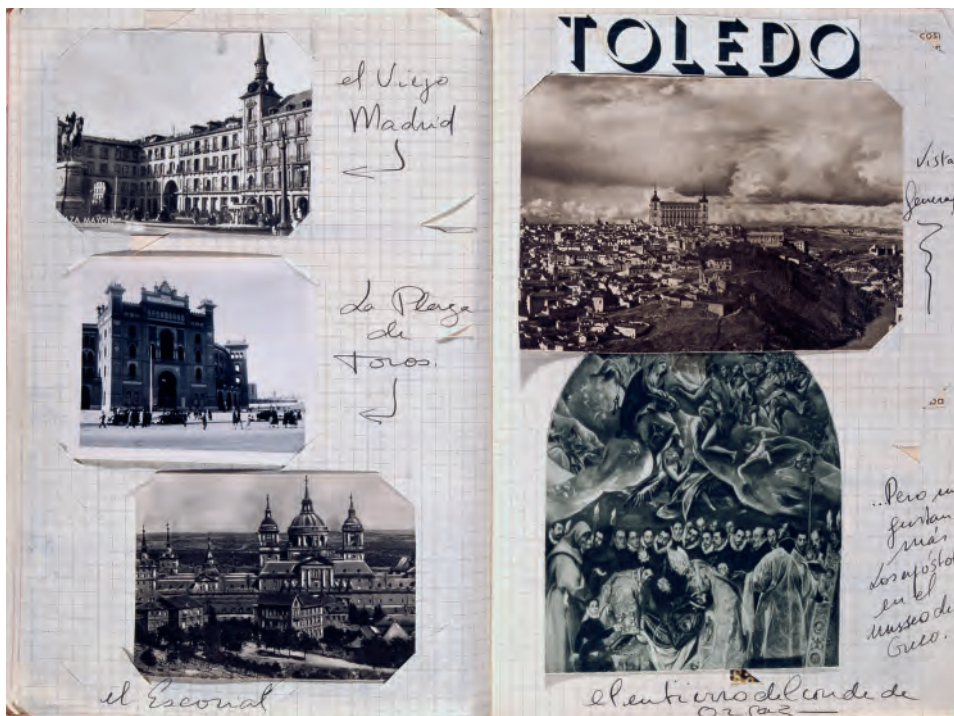
Yves Klein, Diario de España , Madrid, 1951

la gramática, pueda hablar correctamente dentro de un mes (¡con muchas faltas claro!)