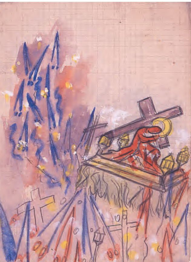
Yves Klein, Cristo con la cruz, acuarela sobre papel, 26 x 20,6 cm, Madrid, 1951