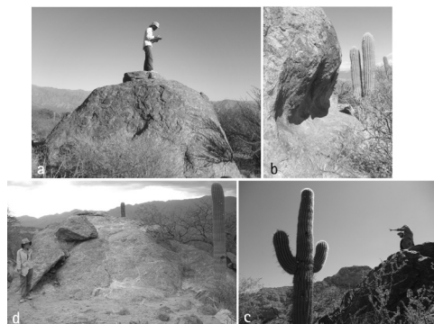
Figura 3. Distintos megalitos en la terraza: (a) y (d) megalitos con morteros en la parte superior; (b) cavidades pulidas de posible origen antrópico; (c) vista desde abajo de megalito con círculos de piedra alrededor de su base.

Estudios etnográficos realizados entre los aborígenes australianos han mostrado como elementos que desde la visión occidental son considerados “naturales”, forman parte de una