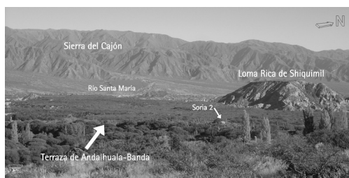
Figura 1. Vista panorámica hacia el noroeste de la terraza de Andalhuala-Banda y la Loma Rica de Shiquimil.