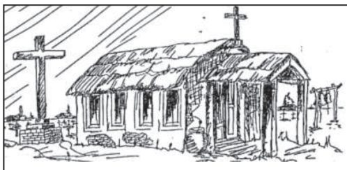
Figura 4. Representación de cómo pudo haber sido la capilla de la Reducción (Tomado de Otamendi 1965:33).

e identidad. Desde el Proyecto Arqueológico Quilmes desarrollamos un programa de extensión con varios espacios alternativos de interacción con la comunidad, a saber: talleres itinerantes, charlas en escuelas, capacitación a docentes de nivel inicial y primario, integración de la comunidad en algunas actividades arqueológicas. El objetivo de este programa es transponer el conocimiento de la investigación de manera directa, in situ , a la comunidad quilmeña, cumpliendo con los propósitos que contienen los diseños curriculares vigentes.