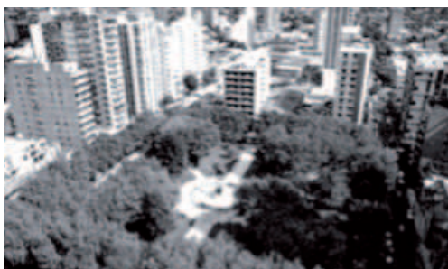
Figura 1. Vista aérea de la plaza San Martín, centro de la manzana histórica.

Desafortunadamente, la falta de recursos económicos, entre otras limitaciones, llevó al desmembramiento del Proyecto Arqueológico Quilmes, hasta que en el año 2003 finalmente se disolvió.