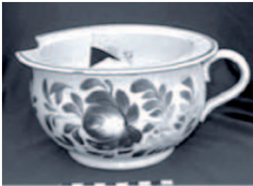
Figura 3. Loza pearlware .

En primer lugar, se ha podido comenzar a trazar los límites del cementerio. Para hacerlo se descartaron los sitios en donde no aparecieron restos humanos, como por ejemplo la plaza San Martín (ubicada frente a la actual catedral).