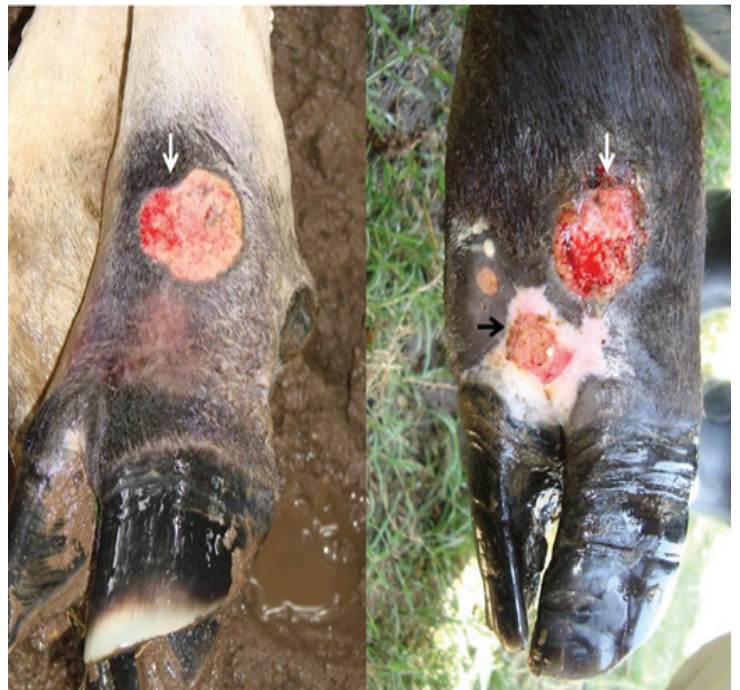
Figura 2. Ulceración granulomatosa con superficie irregular, presencia de material necrótico y exudación fibrino-sanguinolenta (véanse flechas).

Los hallazgos clínicos comunes encontrados en los animales fueron ulceración granulomatosa, con superficie irregular y exudación fibrinosanguinolenta y en algunos casos salida de material purulento a la compresión y presencia de material necrótico (Figura 2). Las lesiones se ubicaron a nivel de porción ventral de cuello y abdomen en 3 casos y a nivel de la porción distal de los miembros en 69 casos (Figura 3), algunos animales presentaron claudicación leve y pérdida de la condición corporal.