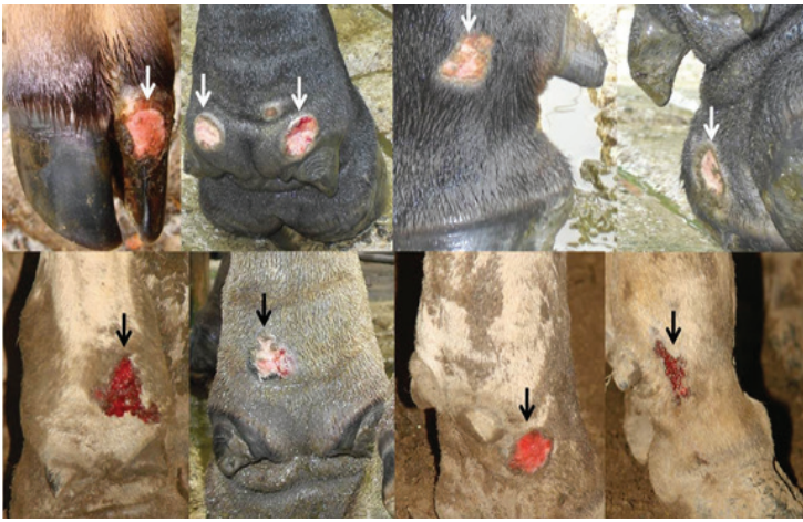
Figura 3. Lesiones circunscritas e irregulares, con presencia de material necrótico y secreción sanguinolenta a nivel de la porción distal de los miembros en diferentes animales (véanse flechas).

En el laboratorio de patología, a las biopsias de tejido se les realizó coloración de (H-E) y Grocott. En la coloración de H-E, se observó severa dermatitis piogranulomatosa multifocal, que consiste en la presencia de múltiples piogranulomas multifocales constituidos por área central con aglomerados de eosinófilos y neutrófilos rodeados por macrófagos e histiocitos formando el fenómeno Splendore-Hoeppli (SH) (Figura 4). Así mismo en la coloración de Grocott, se observaron hifas intralesionales de color café oscuro, ocasionalmente septadas y parcialmente ramificadas con paredes lisas y paralelas (Figura 5).