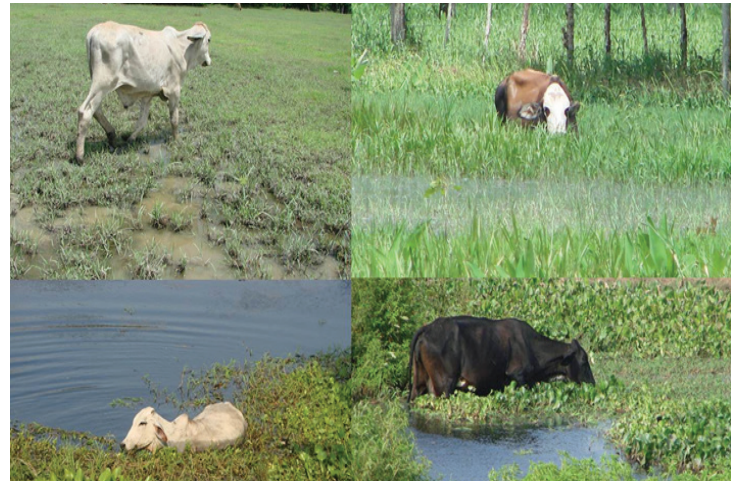
Figura 1. Presencia de potreros inundables donde pastan los animales, ambiente propicio para la reproducción y supervivencia del P. insidiosum .

Los componentes epidemiológicos considerados fueron los antecedentes de pythiosis equina en la región 2 , la presencia de zonas bajas con acumulo de agua, como represas, charcas y potreros inundables donde pastoreaban los animales como sucedió en las áreas rurales de los municipios de Cereté, Ciénaga de Oro y Lorica, Córdoba (Figura 1), de igual forma, los meses del año en los cuales fueron estudiados los animales (mayo a agosto de 2011) que corresponden a la época lluviosa en la costa atlántica Colombiana, debido a que son factores de riesgo importantes para la presentación de Pythiosis cutánea 4,17 .