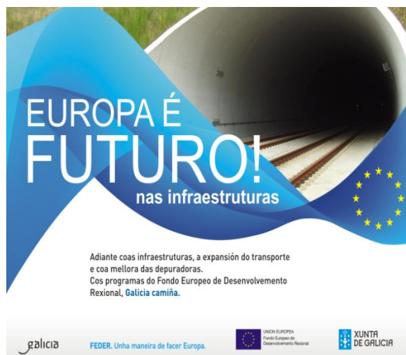
Imagen 1.- Campaña Europa é futuro! nas infraestruturas