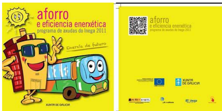
Imagen 5.- Folleto de eficiencia energética