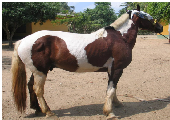
Figura 1. Evaluación neurológica de la ataxia, tapándole los ojos, nótese la renuencia a dar el paso, indicando acentuación de la ataxia.

La ataxia se evaluó neurológicamente, acentuándose más al efectuar círculos, elevar la cabeza o taparle los ojos y evadir obstáculos (Figura 1); al caminar, la debilidad se manifestó por tropiezos con arrastre de la punta del casco; al descansar se observó alteración de la propiocepción manifestada por una postura anormal (Figura 2). La espasticidad se evidenció por disminución de la flexión de la articulación de la rodilla al caminar. Cuando se le instó a moverse atrás (reculeo) el paciente abrió su base de apoyo e inclinó su cuerpo hacia atrás antes de mover sus miembros (Figura 3).