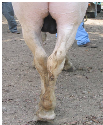
Figura 2. Posición anormal, después de realizar pruebas de propiocepción consciente, dejó el miembro en la posición colocada, debiendo ubicarlo nuevamente en su posición de apoyo.