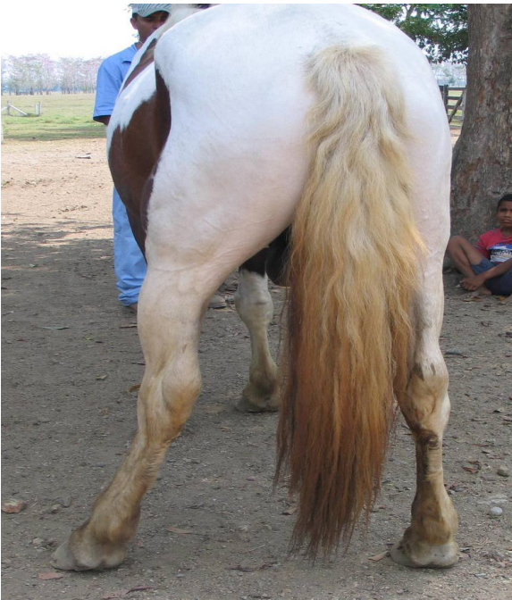
Figura 3. Movimiento hacia atrás (reculeo), el paciente abrió su base de apoyo e inclinó su cuerpo hacia atrás antes de mover sus miembros.

Hay dos manifestaciones clínicas de la enfermedad: La tipo 1, que tiende a ocurrir en animales jóvenes, desde el destete hasta los 2 años de edad, en este tipo se presenta malformación con estenosis del canal vertebral. Es una condición dinámica que ocurre de manera intermitente cuando el animal flexiona el cuello, más frecuentemente afecta las vértebras C3 - C4 y C4 - C5. Un trauma externo puede ser el factor que precipita inicialmente el síndrome clínico (7). La compresión de la médula espinal a nivel cervical en zonas donde las vértebras se encuentran inestables o malformadas, se deben principalmente a anomalías del desarrollo (8).