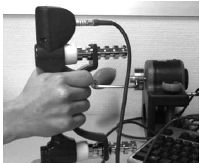
Figura 3 . Medición de fuerza de agarre

4. Test Quick-DASH: es un test que permite valorar la afectación para las actividades de la vida diaria en patologías de miembro superior 6-7. Consta de 11 preguntas, en las que la afectación se puntúa de 1 (mínima) a 5 (máxima). La puntuación final se calcula mediante la fórmula siguiente: [(\text{suma de n respuestas})/n] - 1) \times 25 , donde n es igual al número de respuestas completadas. La puntuación del "Quick Dash" no puede ser calculada si hay más de 1 ítem sin