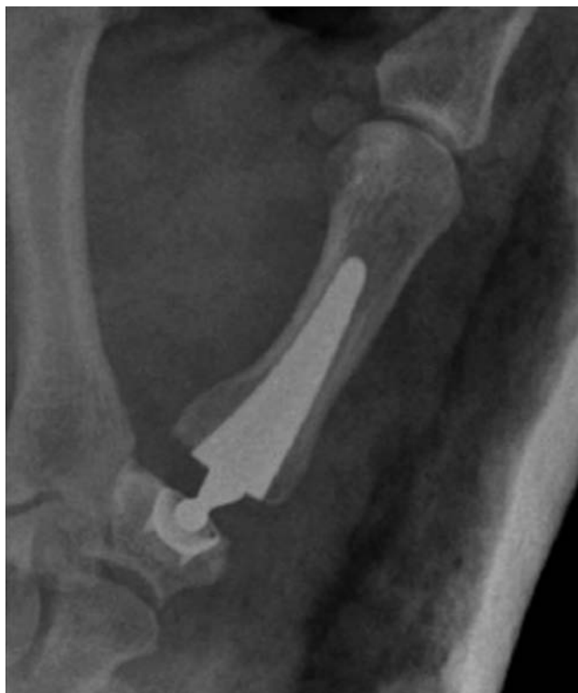
Figura 5 . Prótesis tipo ARPE®.