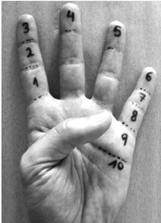
Figura 2 . Diagrama mostrando el sistema de valoración de la oposición del pulgar de Kapandji ( extraído de Borrás JC et al).

pulpejo del pulgar a nivel de la articulación MTCF del 2º dedo) y el 10 el máximo (el pulpejo llega a la articulación MTCF del 5º dedo). Figura 2.