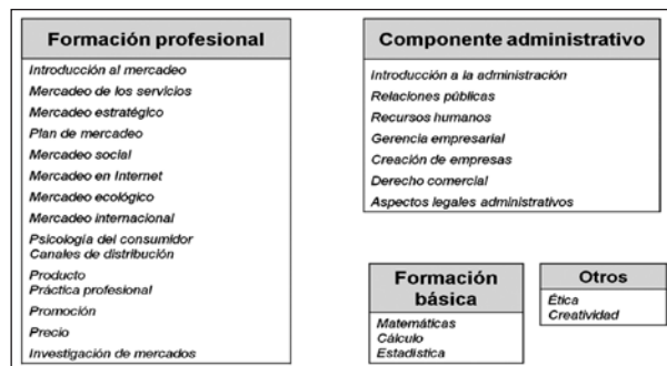
Ilustración 2. Análisis de estructuras curriculares nacionales e internacionales. Componentes dominantes 5 .

Por medio de un análisis que pretendió conocer la tendencia de las estructuras curriculares se realizó un estudio de los currículos de algunas universidades en Latinoamérica, dos de EE. UU. y dos de Europa, según la metodología propuesta. Se encontró que en la formación profesional predominan los cursos de introducción al mercadeo, mercadeo de los servicios, mercadeo estratégico, plan de mercadeo, mercadeo social, mercadeo en Internet, mercadeo ecológico, mercadeo internacional, psicología del consumidor, producto, promoción, precio e investigación de mercados. En el componente administrativo están la introducción a la administración, relaciones públicas, recursos humanos, gerencia empresarial, creación de empresas, derecho comercial y aspectos legales administrativos. La formación básica está basada principalmente en matemáticas, cálculo y estadística. En otras asignaturas se destacan la ética y la creatividad.