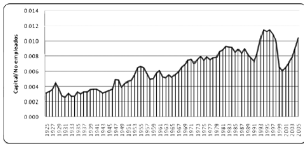
Ilustración 2. Formación interna bruta de capital físico por trabajador (fibkf/no empleados), 1925-2005. (Millones de pesos de 1975). 18