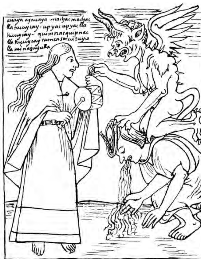
Felipe Guamán Poma de Ayala, El Primer Nueva Coronica y Buen Gobierno , 1618: un miembro del movimiento Taki Onqoy con un indio alcoholizado que es controlado por un huaca representado como el Diablo.

CONFERENCIA DE COMUNES Y BRUJAS 13.10.10 PARTICIPA SILVIA FEDERICI ORGANIZA TRAFICANTES DE SUEÑOS • CBA