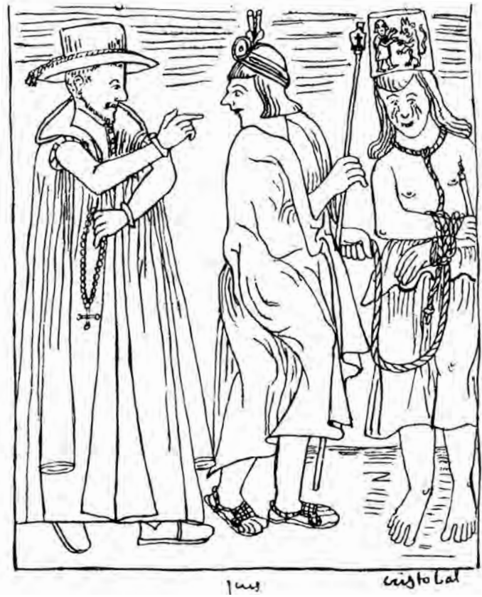
Felipe Guamán Poma de Ayala, El Primer Nueva Coronica y Buen Gobierno , 1618: humillación pública durante una campaña contra la idolatría

La caza de brujas se convierte en un fenómeno masivo a partir de la segunda mitad del siglo XVI. Creo que en ese contexto se puede demostrar convincentemente que la ideología de la brujería se convierte en algo nuevo. En concreto, las nuevas élites europeas utilizan la caza de brujas para acabar con todo un universo de prácticas sociales que necesitan destruir para consolidar su poder. Uno de los elementos centrales de esta ofensiva es el control de las mujeres, de la reproducción, de su sexualidad y de su cuerpo. Es muy fácil rastrear esta línea de ataque en el tipo de acusaciones que se hacía contra las mujeres. Matar niños, volver a los hombres impotentes o fabricar venenos contraceptivos son cargos que frecuentemente se utilizan contra las brujas y que reflejan bien la criminalización de la contracepción. La mendicidad es otra línea de ataque de la caza de brujas, sobre todo en Inglaterra. Muchas de las mujeres que fueron acusadas de brujería eran mendigas que