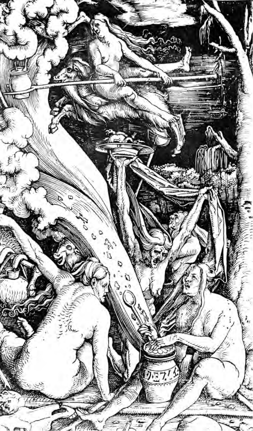
Hans Bandung Grien, Aquelarre , 1510

implica un modelo de sociabilidad muy restringido y una serie de ineficiencias productivas. En este sentido, para Marx los cercamientos eran inevitables. Pero en la Edad Media no existía tanto la pequeña propiedad como las tierras comunales. Sin ánimo de idealizar, éstas permitían una construcción colectiva de la vida basada en la reciprocidad en las relaciones laborales y de intercambio. En resumen, la pequeña propiedad y sus connotaciones sociales no representan adecuadamente el tipo de vida comunal que se estaba produciendo a finales de la Edad Media.