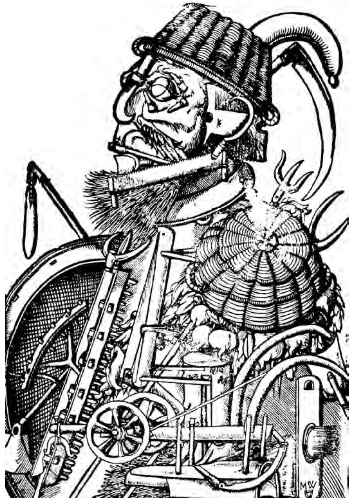
Anónimo, grabado alemán del siglo XVI

Las mujeres no tenían el mismo tipo de problemas que los hombres bajo el feudalismo, de la misma manera que las zonas rurales no tenían los mismos problemas que las zonas urbanas. Pero en el periodo feudal, en la medida en que se producía para el consumo