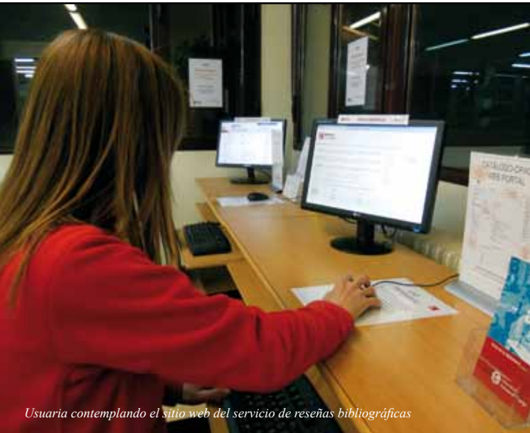
Usuaria contemplando el sitio web del servicio de reseñas bibliográficas

también resulta de utilidad, pues desde el propio catálogo puede hacerse una idea de la opinión que tiene un colega sobre una obra, enriquecer con una nueva ficha la descripción de la misma o, incluso servir de vehículo de comunicación ante supuestos casos de intereses parejos en investigación, ya que estas fichas incluyen algunos datos de contacto.