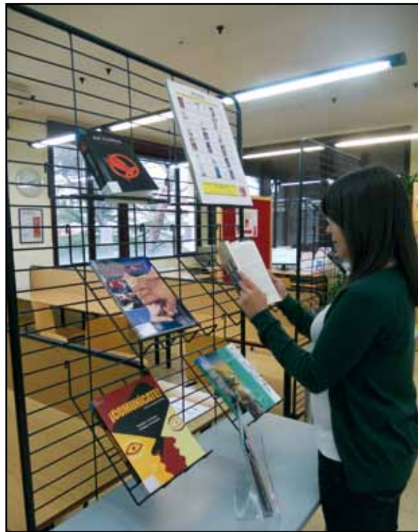
Lectora consultando alguna de las novedades con ficha de lectura

Para probar la funcionalidad y pertinencia del diseño de plantilla que habíamos creado, seleccionamos un par de libros de la colección y nos dedicamos a la tarea de la reseña. Con los primeros resultados seguimos los pasos descritos anteriormente hasta que vimos las fichas de lectura publicadas junto al registro bibliográfico correspondiente. Tanto la fase de consignación de la plantilla –durante la que habíamos observado algunos errores y lagunas– como la fase de vista en publicación –en la que también observamos ausencias importantes y elementos de mejora– dieron la pista de los cambios y modificaciones que debíamos hacer. No solo teníamos en cuenta los problemas y dudas con los que el colaborador se encontraría frente a la plantilla, sino también las