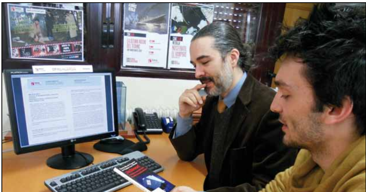
Profesor y alumno examinando una ficha de lectura y el libro a que hace referencia

Así es. En la Biblioteca de la Universidad Nebrija hemos diseñado un servicio de recomendaciones bibliográficas que hemos denominado La experta opinión de... Se trata de unas fichas de lectura o visionado sobre obras concretas –ya sean libros, revistas, artículos de revistas o videograbaciones–