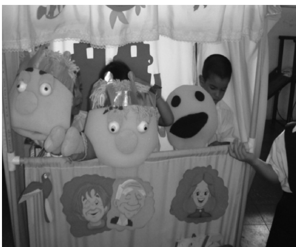
Fotografía 10. El teatrino

El balance de las secuencias didácticas para dar cuenta del desarrollo del proyecto de aula permite señalar las siguientes apreciaciones: