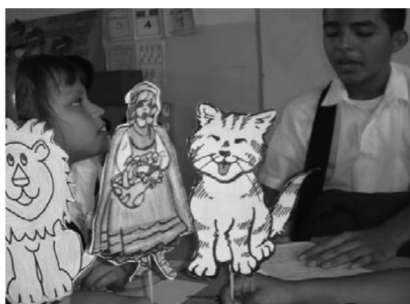
Fotografía 6. Construcción de guiones

ción de la idea del guión y construcción colectiva del guión.