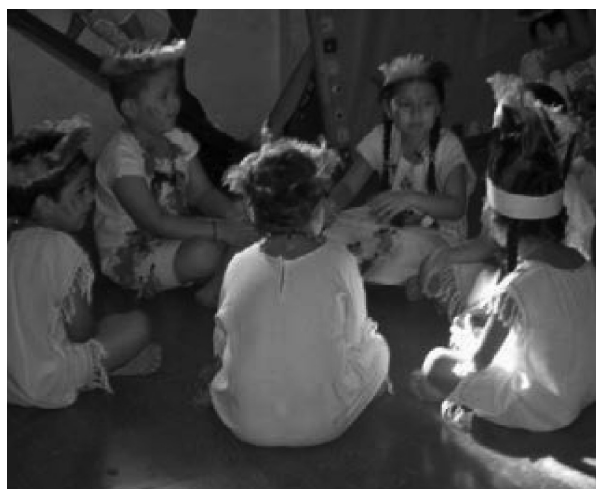
Fotografía 3. Conversaciones

Hay diversidad de situaciones y de funciones del habla en clase, en donde se habla para regular la integración, para aprender a hablar y escuchar, escribir y leer.