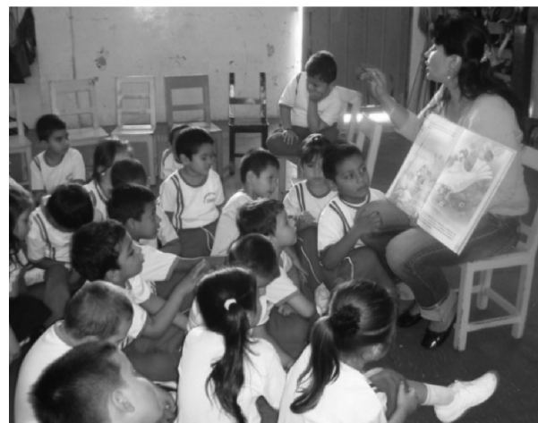
Fotografía 4. Lectura de cuentos

Creando personajes: la socialización de experiencias de vida cotidiana, narración de cuentos infantiles, fábulas y lectura de textos icónicos, se constituyeron en actividades inspiradoras para seleccionar e