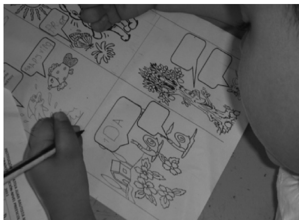
Fotografía 5. Texto en la imagen

Se desarrollaron diversas actividades entre ellas: diseño del personaje, creación de su historia, selec-