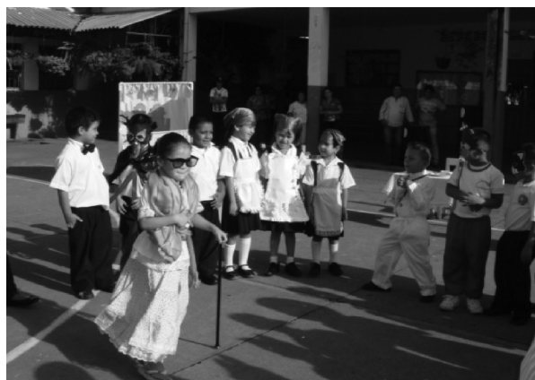
Fotografía 2. Día de disfraces

Cita con mis personajes preferidos: Tal y como el grupo lo había propuesto, llegaron al colegio con un disfraz. La actividad consistió en que cada cual hacía la presentación de su personaje con una actuación espontánea. Finalmente, realizaron un juego de roles donde surgieron diversas situaciones de su vida cotidiana: amores, conflictos, fantasías e ilusiones.