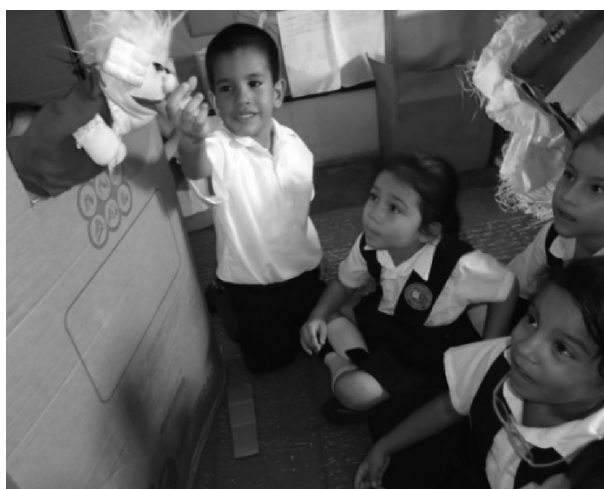
Fotografía 1. El rincón de los títeres

El festival de la alegría: Esta actividad fue organizada con el grupo, en donde ellos eligieron diversos rincones de trabajo y colaboraron en su organización previa. De allí resultaron actividades como: juego de roles, cuentos, pintura, títeres, rompecabezas y pensamiento matemático. Su participación fue significativa, el rincón más visitado fue el de los títeres, improvisaron el titiritero con una caja y se disputaban el turno.