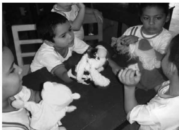
Fotografía 7. El personaje hecho títere

Diseño del personaje: de manera individual se elaboró el diseño en el cuaderno, imaginando cómo sería un títere con su personaje, se le asignó un nombre y se expuso a la asamblea del curso. Lo llevaron a su casa y la familia colaboró ayudando a elaborar el títere.