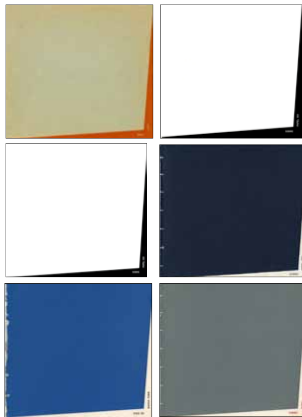
Portadas Serie Sobre Papel

La IV edición de Sobre papel inaugurada el 5 de enero de 1969, tenía como propósito dar a conocer dibujos, grabados, fotografías y acuarelas de artistas venezolanos y extranjeros, entre los cuales se encontraban: Abularach, Baumeister, Castillo, Cremean, Ernst, Lam, Laurencin, Laurens, Magritte, Nikolajevic, Picasso, Poleo, Reichek y Sotillo. Según Miguel Arroyo “la muestra reúne técnicas muy diversas: es pues, una exposición heterogénea que permitirá al espectador apreciar los diferentes métodos de trabajo de estos 18 artistas”. Entre las obras catalogadas como de gran interés para el público estaba un grabado en buril de Pablo Picasso (1945), una obra de Magritte (1964) y una obra de Marie Laurencin (1906), estas dos últimas eran exhibidas por primera vez en el país. La exposición fue comentada en la columna cultural Ras-guños: “la actual exposición de grabados del Museo, en la serie “Sobre papel”, organizada por Leuffert con la supervisión de Arroyo, sin ser de piezas excepcionales es de un carácter didáctico ejemplar y muy bien montada, con litografías en negro y color, serigra-