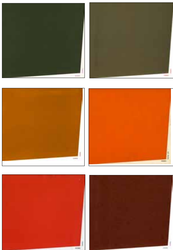
Portadas Serie Sobre Papel

En 1968 el Museo de Bellas Artes (MBA) dio inicio a Sobre papel , exposiciones destinadas a la exhibición de obras realizadas sobre este soporte, utilizando diversas técnicas como dibujo, collage, grabado, litografía, fotografía, escritura; entre otros.