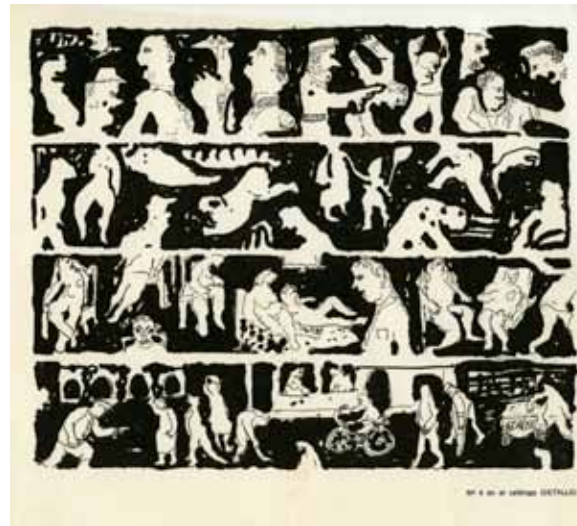
Serie Sobre Papel, Exposición Escrituras de Juan Calzadilla