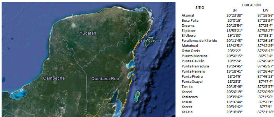
Figura 1. Localización de los sitios de muestreo.

En nuestro caso seleccionamos diecisiete variables ( X_i ), las cuales pensamos que son relevantes para la dinámica de playas en las costas de Quintana Roo: 1. Población, 2. Playa arenosa, 3. Costa Rocosa, 4. Corrientes litorales, 5. Transporte de sedimentos, 6. Hoteles, 7. Turismo, 8. Erosión, 9. Acreción, 10. Limpieza de playas, 11. Relleno de playas, 12. Cambios de pendiente, 13. Biodiversidad, 14. Hábitats, 15. Tormentas/huracanes, 16. Construcción de casas, 17. Presencia de un Arrecife de coral.