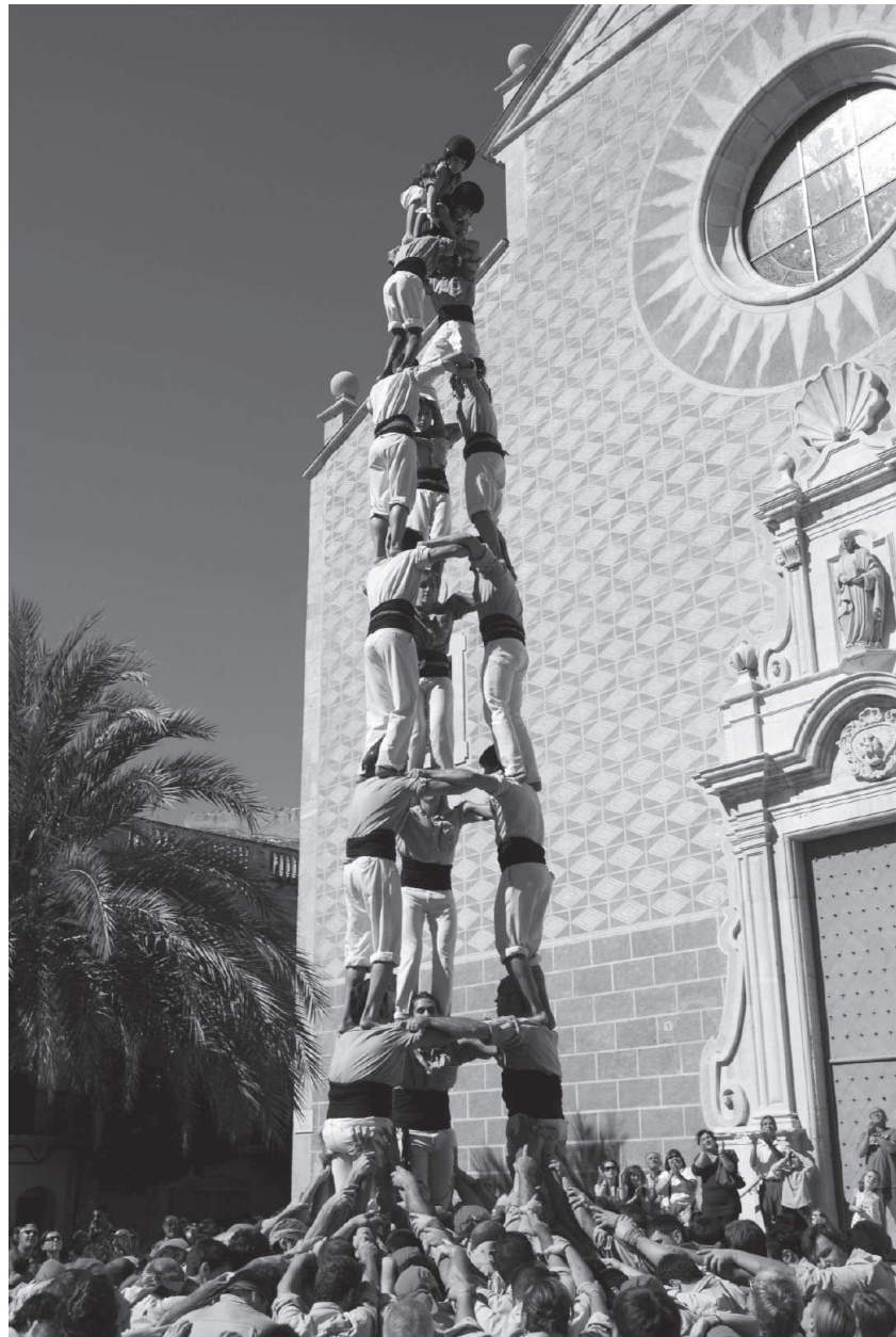
Aquest tres de vuit descarregat per la colla Jove dels Xiquets de Tarragona el passat 9 d'octubre del 2011 esdevé, fins avui, el castell de major entitat alçat a Constantí al llarg del segle XX i fins el 2011.