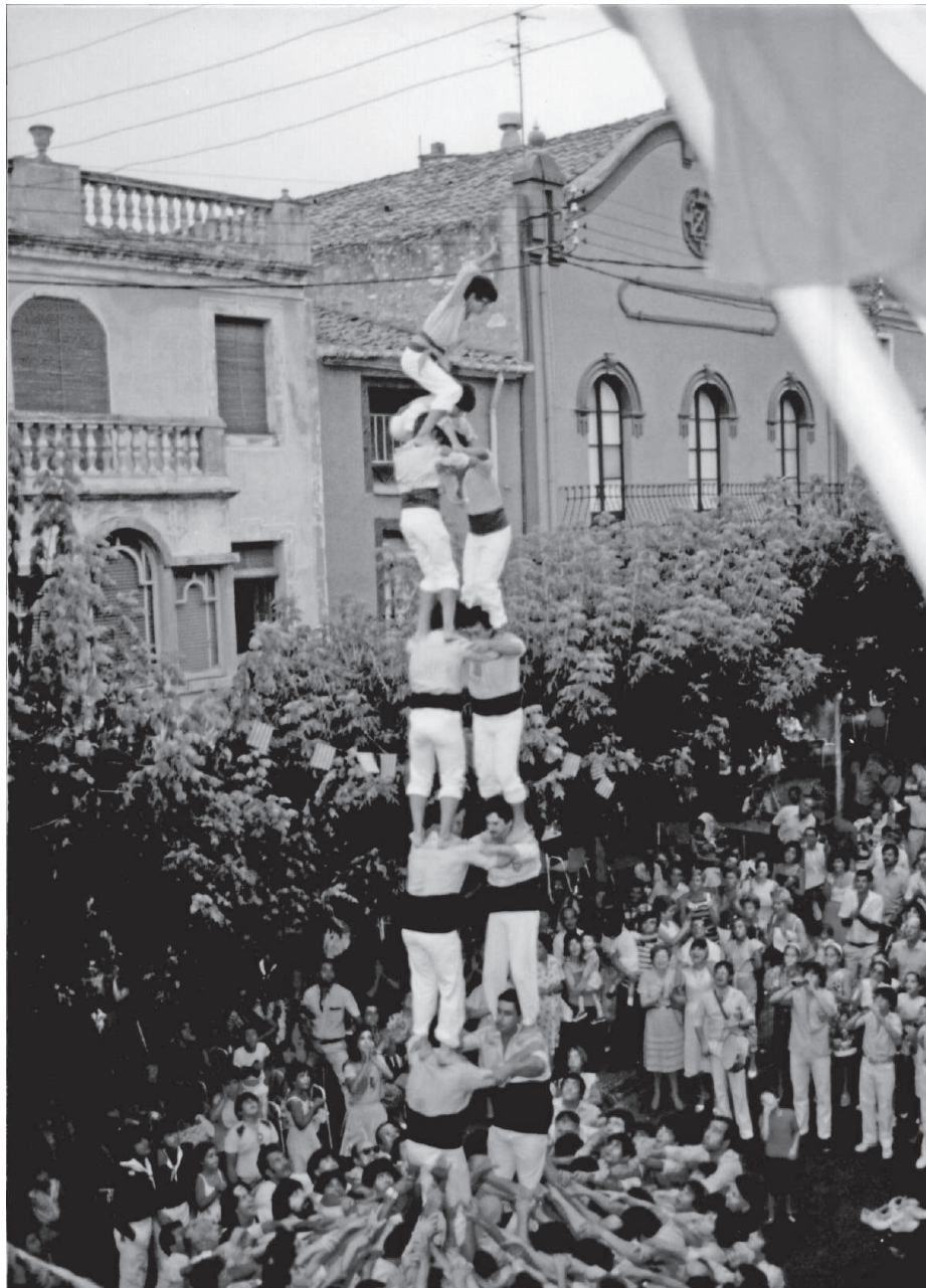
Aquest dos de set carregat pels Xiquets de Tarragona durant la festa major de Constantí del 1984 va esdevenir el castell més important alçat fins llavors en el segle XX a la vila.