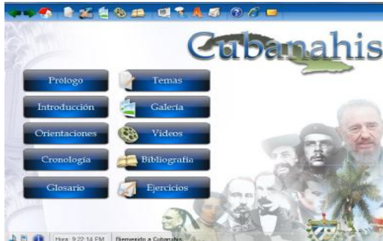
Fig 1. Página de inicio.