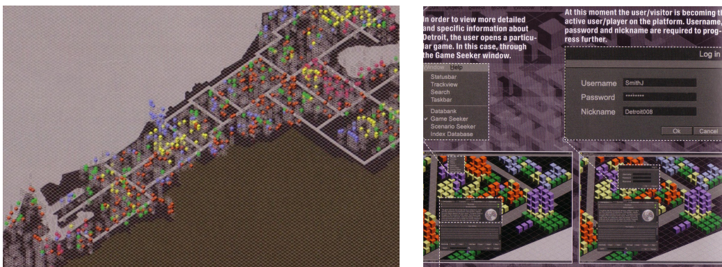
Fig. 4. Simulación a tiempo real del cambio del valor del suelo en Dubai en función del contexto urbano y accesible a escala global. MVRDV (2007), Spacefighter .

De este punto de vista ya se puede afirmar que, en el ámbito de la planificación urbana, las propuestas más novedosas y arriesgadas ensayadas hasta ahora se reducen a aquellas que toman como base el método de análisis espacial propuesto en los ochenta por Hillier en The Social Logic of Space , y por el cual a través del proceso computacional de una secuencia de mediciones capturadas en diferentes instantes, se estudian la lógica relacional de las personas y la capacidad de acogida que una forma urbana concreta ofrece para así prever los efectos de la planificación y toma de decisiones sobre cualquier elemento urbano en tales áreas. 11 En la práctica, algunos grupos interdisciplinarios que manejan estas metodologías de trabajo han concluido, en su búsqueda por un “desarrollo del urbanismo más sostenible en la nueva era de la información y el conocimiento”, con la definición de unos manidos indicadores como principio de diseño preciso y herramienta guía al desarrollo a través cualquier instrumento de planeamiento, ante la preocupación por una realidad material finita (Rueda, 2007). En resumidas cuentas, las repercusiones materiales de todo lo anterior ensayadas a día de hoy, se reducen a poco más que términos de un sistema de navegación inteligente, de distancias mínimas a intercambiadores de transporte, o de paneles informativos como parte del mobiliario urbano (Lamíquez, 2007).