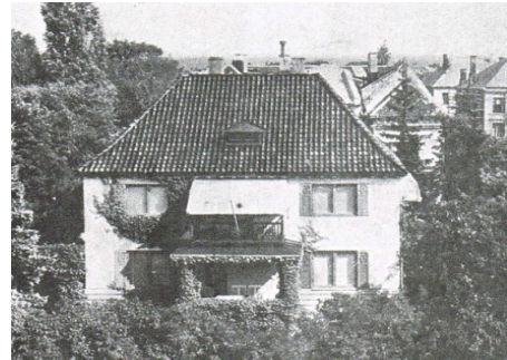
Fig. 2 Arquitectura Parvenu. Norberg-Schulz. Intenciones en Arquitectura

En el ámbito concreto del urbanismo, la defensa del centro urbano y el concepto de lugar encuentran su ámbito político de recepción en la izquierda italiana reunida alrededor de Casabella-Continuitá . Allí, partiendo del famoso artículo “The Heart, Human Problem of Cities” expuesto por E. N. Rogers en el VIII Congreso de los CIAM –temática también tratada desde diversas perspectivas por Muratori, de Carlo o Aymonino entre otros- será Aldo Rossi quien efectúe una precisa investigación en torno al problema de los centros urbanos de las ciudades históricas mediante una noción de lugar que, lejos de alinearse con las visiones primitivistas y nostálgicas de la versión noreuropea, intentará impulsar la continuidad histórica de la centralidad urbana como forma propia y creativa de mantener la propia cultura. 1 Ahora bien, esta introducción de la historia como fundamento básico de la labor de urbanistas y arquitectos posee un doble filo que, al final, se revelará como causa última del fracaso de la propuesta rossiana. Este doble filo no es sino la introducción del ámbito temporal como factor primario del desarrollo urbano. Un ámbito que unido a la necesidad del control y organización territorial transformará finalmente la disciplina de la ordenación urbana en lo que siempre ha sido, a saber, en palabras de Paul Virilio, “dromología”, o ciencia de las velocidades. 2