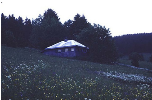
Fig. 1 Cabaña de Heidegger en la Selva Negra