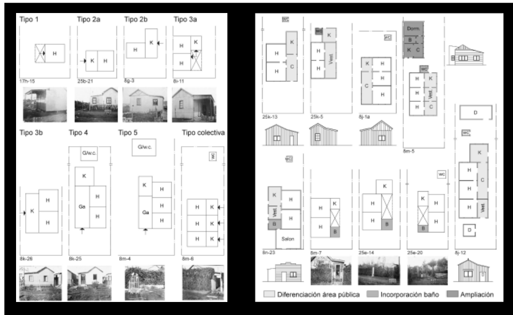
Imagen 5- Fuentes: planchetas catastrales y expedientes de Obras Privadas, Archivo de la Municipalidad de General Pueyrredón.

Imagen 4- Ejemplos en base a los tipos elaborados. Fuentes: planchetas catastrales y expedientes de Obras Privadas, Archivo de la Municipalidad de General Pueyrredón.