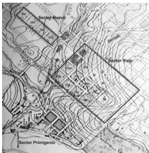
Imagen 3- Se señalan en el plano realizado en base a la aerofoto de 1935 (intendencia de J. Camusso) los sectores seleccionados como muestra. Las manzanas con nomenclatura catastral eran las ocupadas.

La casilla se montaba en seco colocándose sobre puntales de madera a unos 50 centímetros sobre la tierra a fin de permitir la ventilación, evitar el ataque de hongos por la humedad y protegerse de las inundaciones. Asimismo, la elevación facilitaba colocar los ejes y las ruedas, para ser tirada por caballos, en caso de querer ser trasladada. Se apoyaba sobre puntales de madera sobre los que se acomodaban las vigas maestras