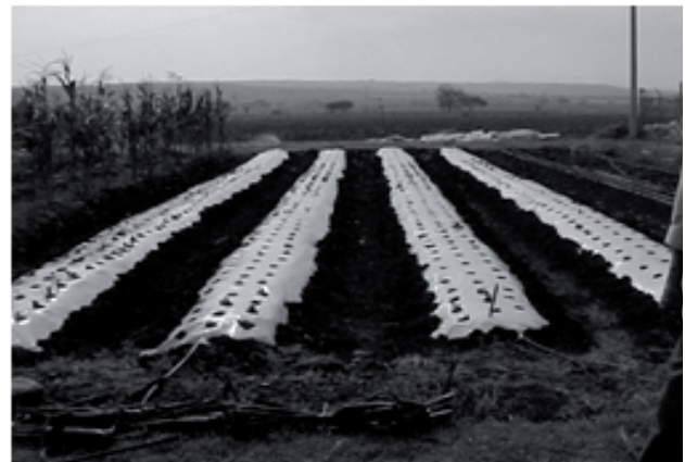
Figura 1. Parcela de evaluación. Figure 1. Evaluation plot.

On the end of each ridge, a valve was placed to independently divide the flow to each one of them (Figure 1). The plants used were: first cycle, frozen, of a Camarosa variety, provided by the National Strawberry Institute (CONAFRE), from greenhouses in California, USA.