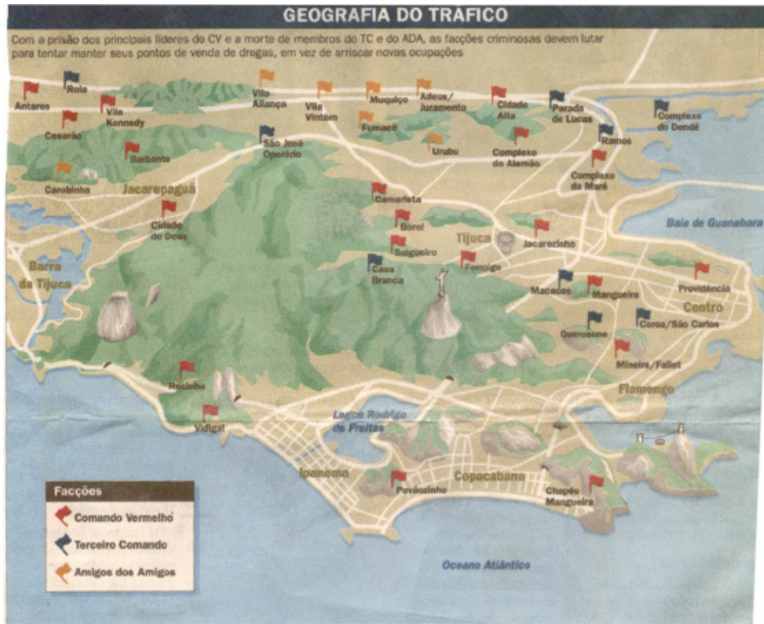
Figura 4 - Facções Criminosas e Pontos de Venda de Drogas Ilícitas na Cidade do Rio de Janeiro, 2002

Um mapa do tráfico de drogas no livro didático: encontros e desencontros entre geografia escolar e cartografia midiática André Reyes Novaes