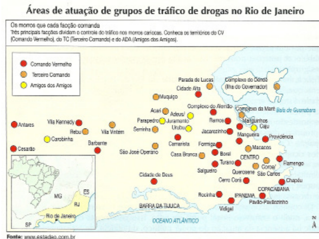
Figura 1 - Facções Criminosas e Pontos de Venda de Drogas Ilícitas na Cidade do Rio de Janeiro, 2007

Deve-se compreender que a própria natureza do mapa auxilia essa função de “ligar”, “conectar” e “amarrar” categorias selecionadas em um plano propositivo comum (WOOD, 2010, p. 2). Segundo Wood (2010, p. 4), o mapa pode ser definido por este plano e sua relação propositiva que busca estabelecer a conexão entre os elementos selecionados: “‘estas coisas vão juntas’, nos fala o mapa” (WOOD, 2010, p. 4). Ao associar favela e tráfico de drogas o mapa inserido no livro didático pode ter reproduzido silêncios e destaques reveladores das relações de poder operantes nas grandes cidades brasileiras. Mas