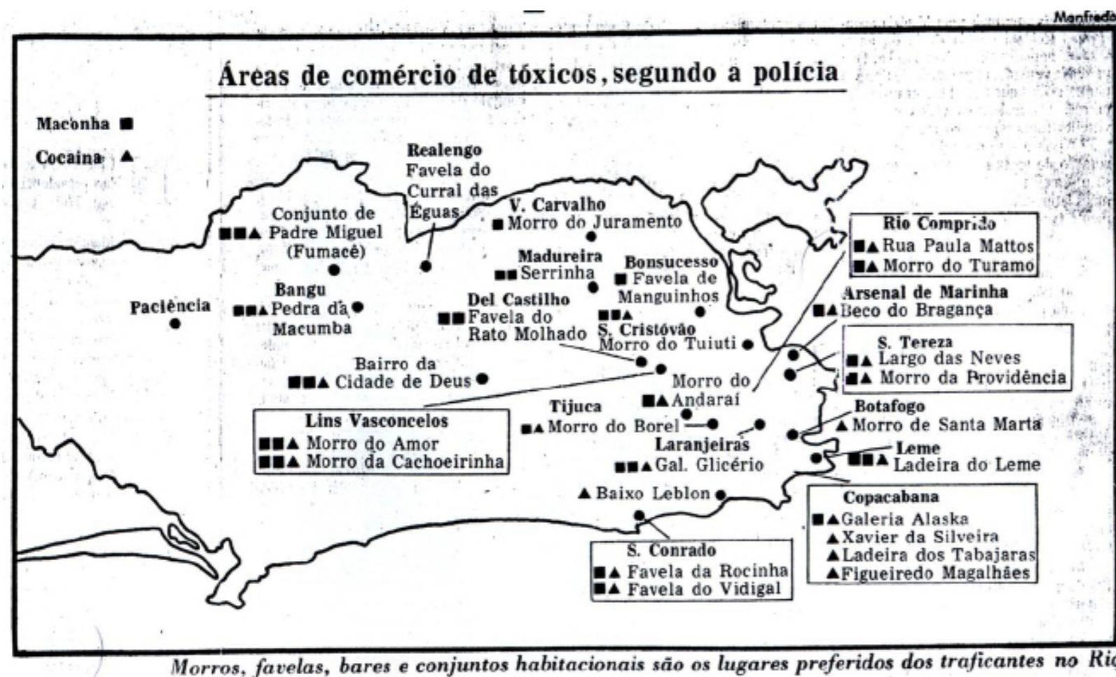
Figura 3 – Locais de Venda de Drogas Ilícitas na Cidade do Rio de Janeiro, 1983

Seguindo a tendência do mapa anterior (Figura 2), aqui também existe um detalhamento maior nos locais de tráfico situados fora das favelas. O pouco conhecimento que grande parte dos leitores e dos produtores do mapa possuía sobre as ruas, esquinas e bares das favelas, fazem com que não haja estranhamento na nomeação de um