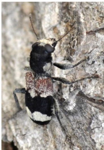
Fig. 2. Individuo de Alicante.