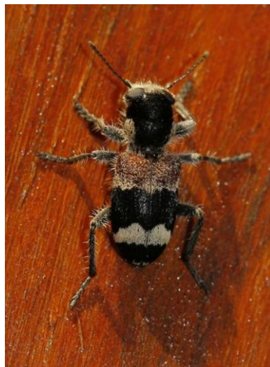
Fig. 3. Individuo de Valencia.