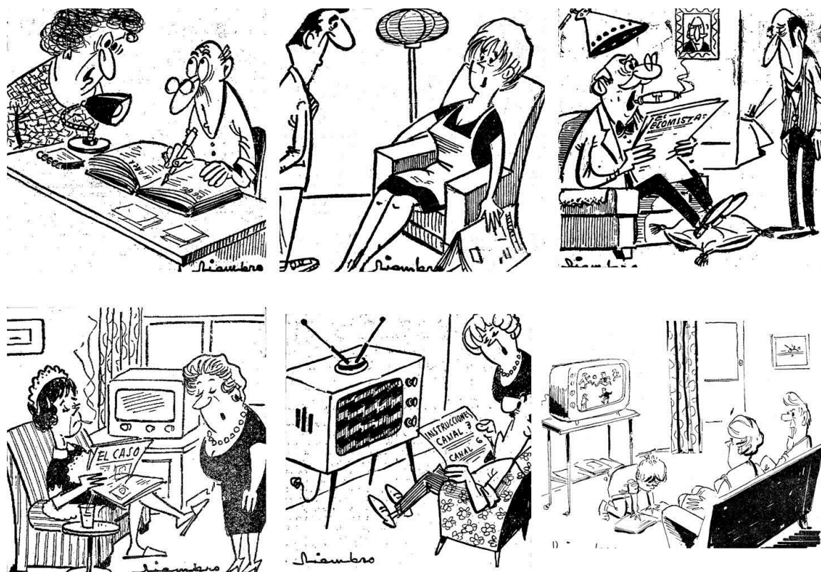
Fig. 2. Ilustraciones del salón, Tomás Niembro, La Nueva España , de 1961 a 1966