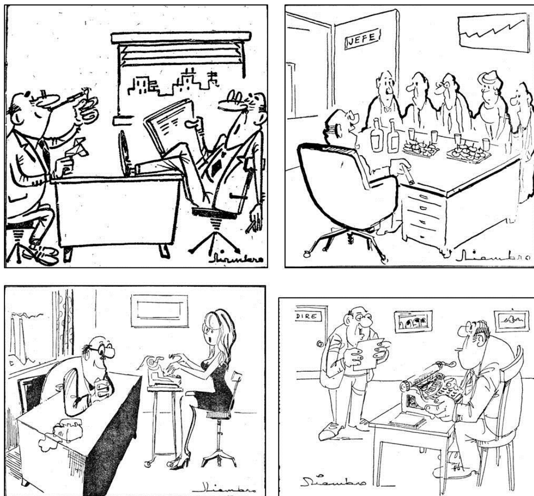
Fig. 3. Oficinas , Tomás Niembro, La Nueva España , de 1961 a 1971

En cuanto a las butacas y sofás se mantiene también esta estética de los 50, líneas puras, sin demasiado adorno e incluso materiales naturales como el mimbre tejido 12 siguiendo el modelo de la silla Dizel o la Bombay 13 .