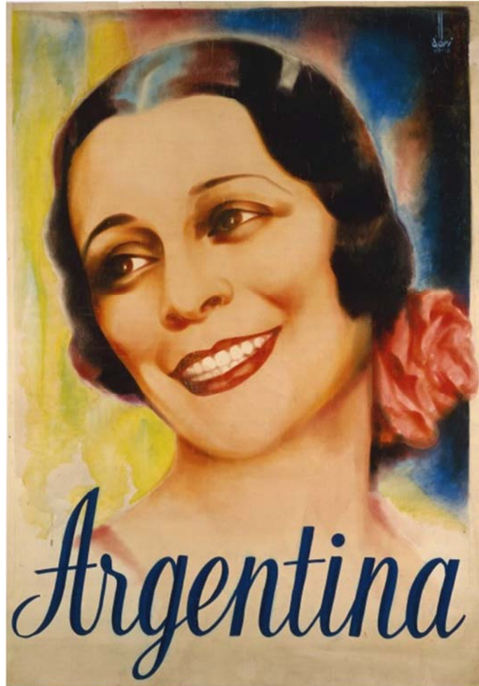
Antonia Mercé llamada "La Argentina" Cartel siglo XX Département des arts du spectacle y Bibliothèque du Musée de l'Opéra