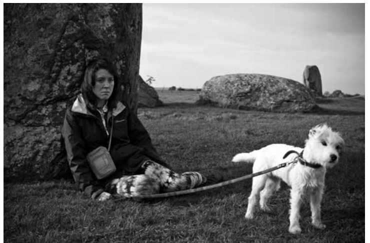
Holy Motors i Sightseers

tota la vida, realment increïble i que no li escau gens. També va estar fora de lloc la reflexió que ens va regalar la filla de David Lynch, quan va dir que la pretensió de Chained obra era destacar la importància d'educar bé als nostres fills... En prenc nota, no mataré més prostitutes davant dels meus fills, senyora Lynch.