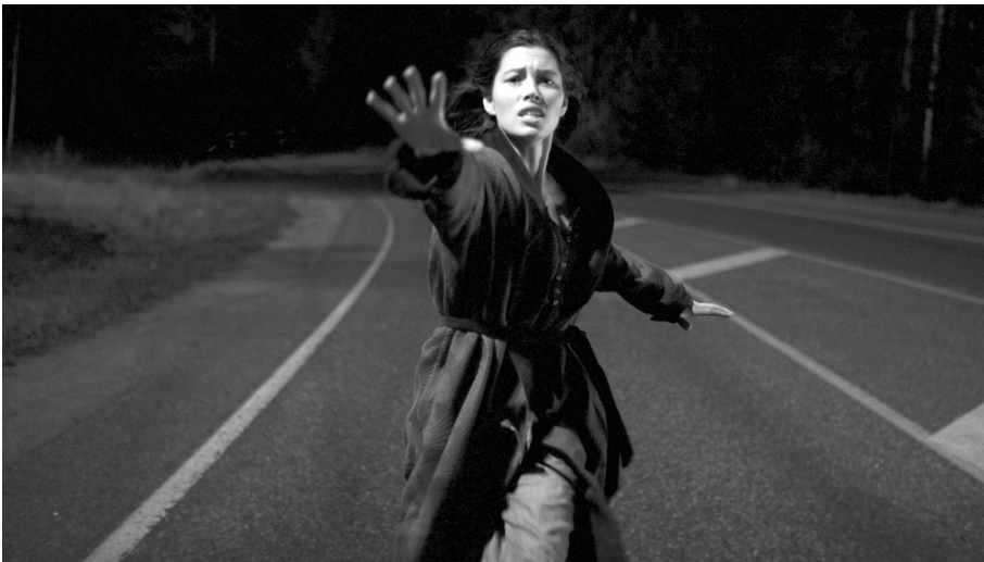
The Tall Man

de l'original i va sorprendre gratament, gràcies al punt de vista amb càmera subjectiva de l'assassí, un guió prou sòlid i una violència molt extrema per un film de classe "A". Altres slashers van fer les delícies dels aficionats a Sitges, com No one lives de Ryuhei Kitamura, 13 Eerie , de Lovell Dean, i la cinta de vampirs The Thompsons .